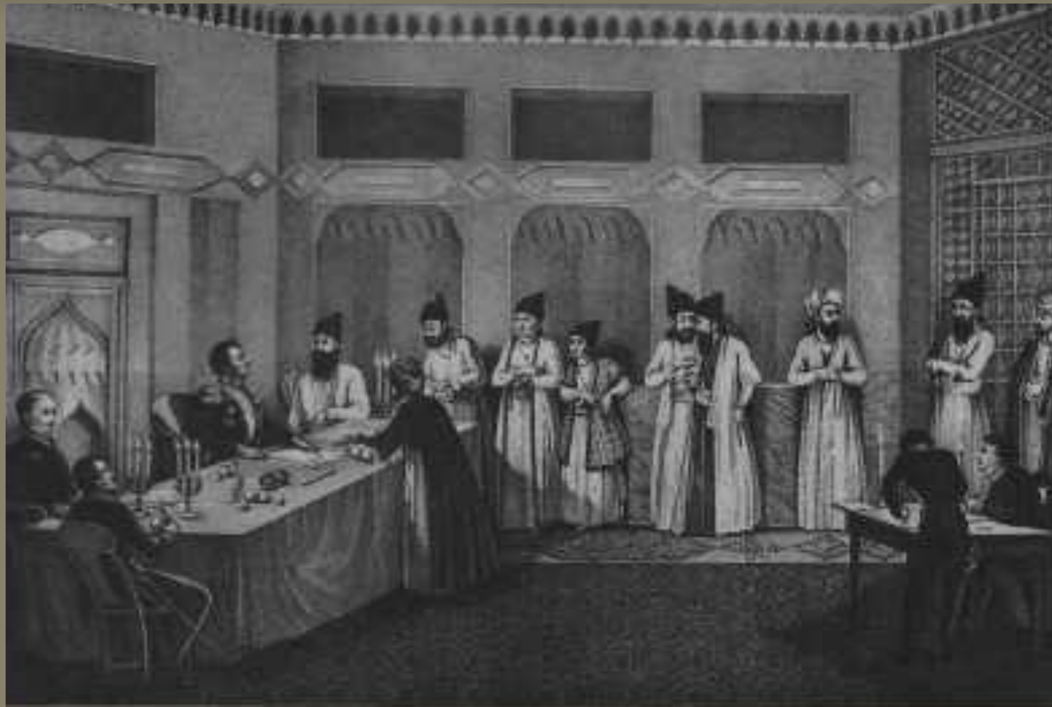
Заключение Туркманчайского мира Художник В. Машков