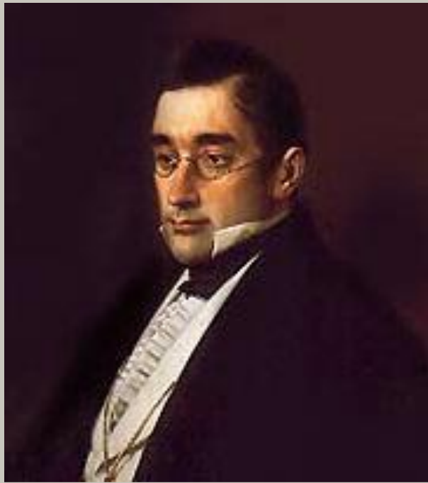
Крамской Портрет Грибоедова