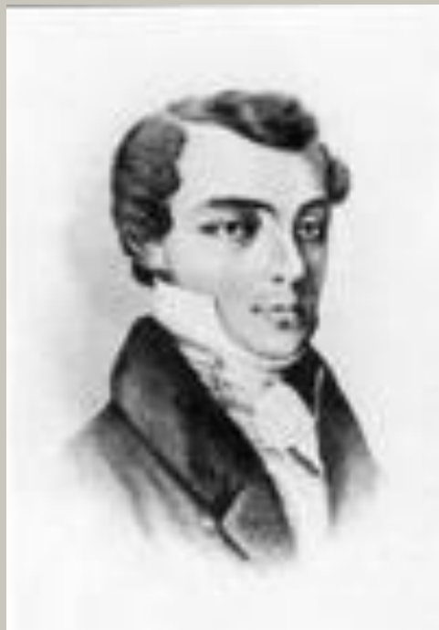
К. Ф. Рылов