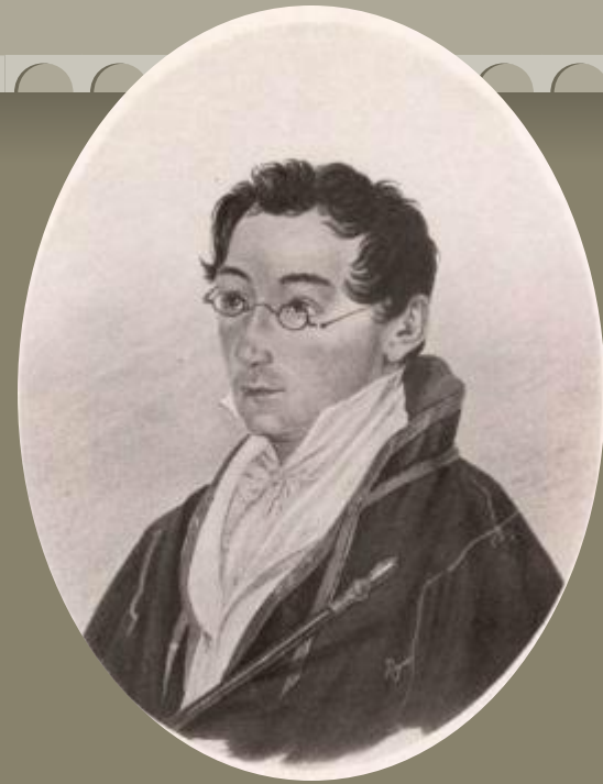
Акварель В. И. Машкова

«Его меланхолический характер, его озлобленный ум, его добродушие, самые слабости и пороки, неизменные спутники человечества, — все в нем было необыкновенно привлекательно»