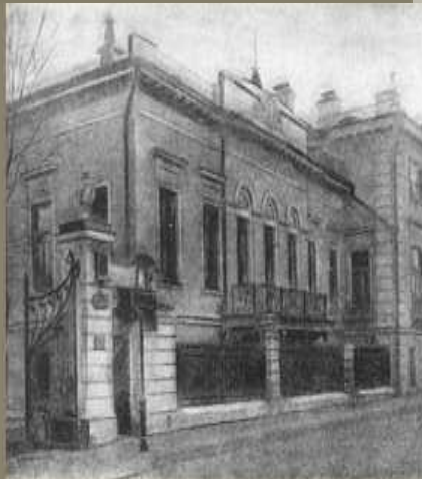
Дом Н. С. Бегичева в Москве