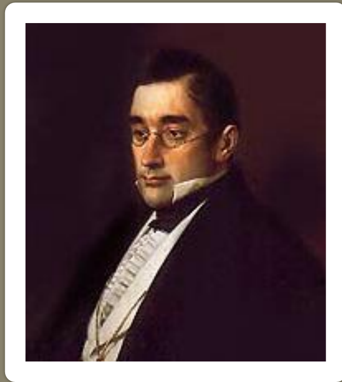
А. С. Грибоедов