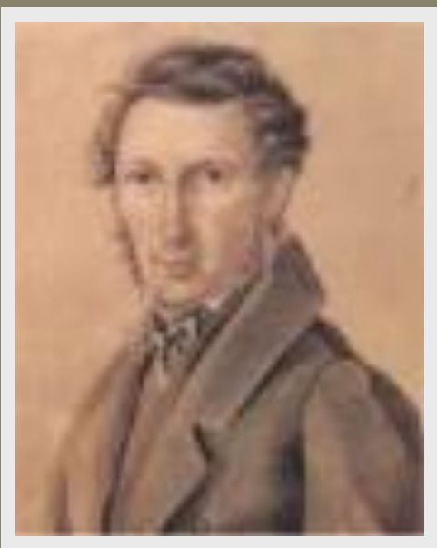
С. П. Трубецкой