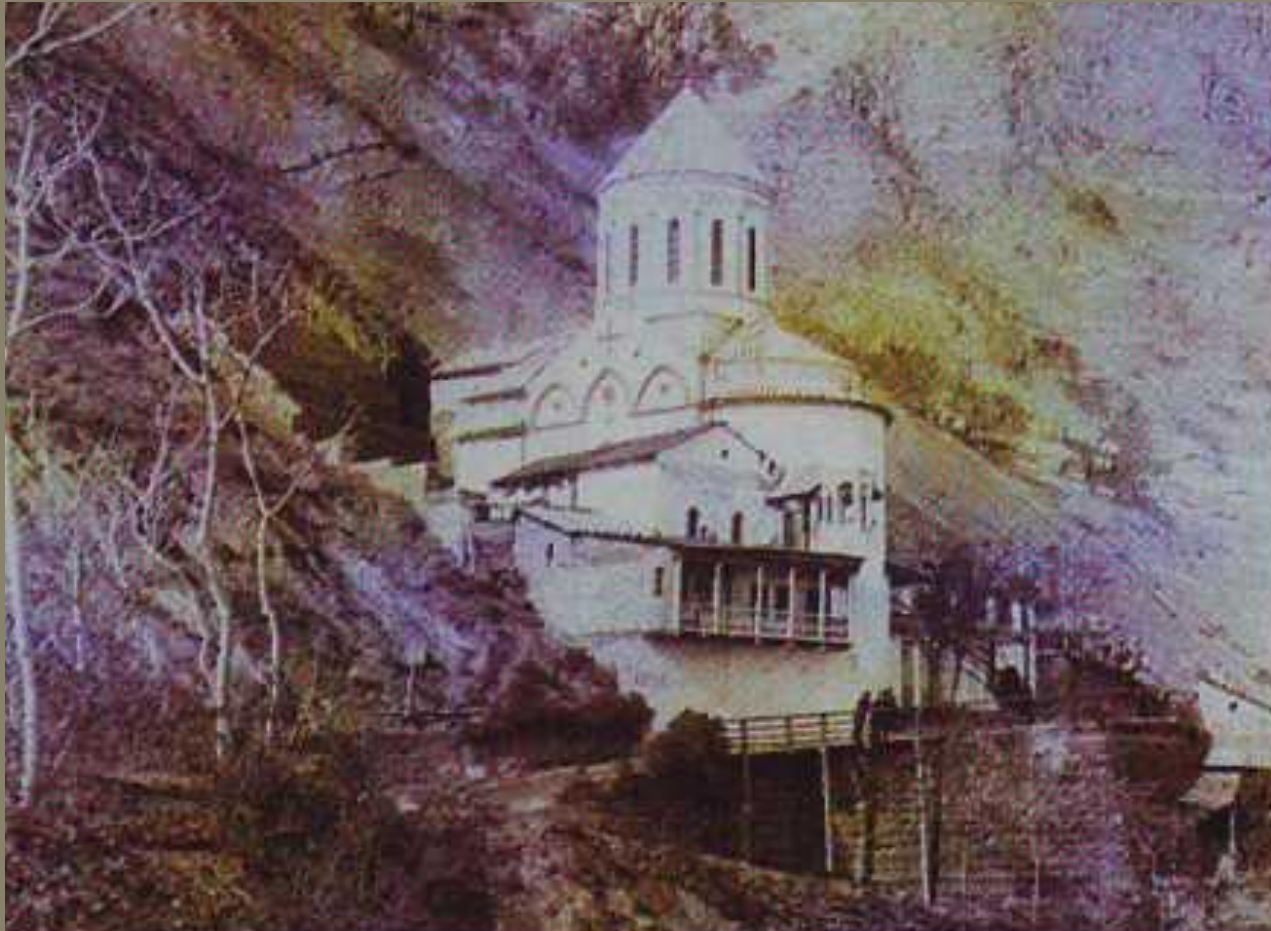
Монастырь Святого Давида фотография конца XIX века