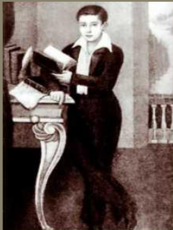
Юный А. С. Грибоедов в Хмелите