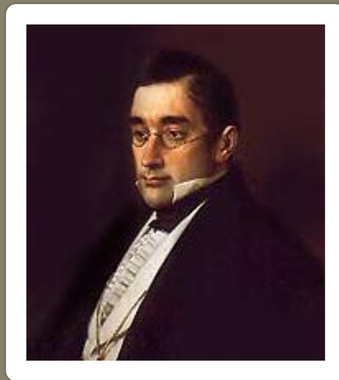
А. С. Грибоедов