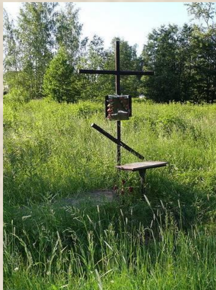
Крест-кенотаф в вероятном месте расстрела Н. С. Гумилева. Бернгардовка (долина реки Лубьи)