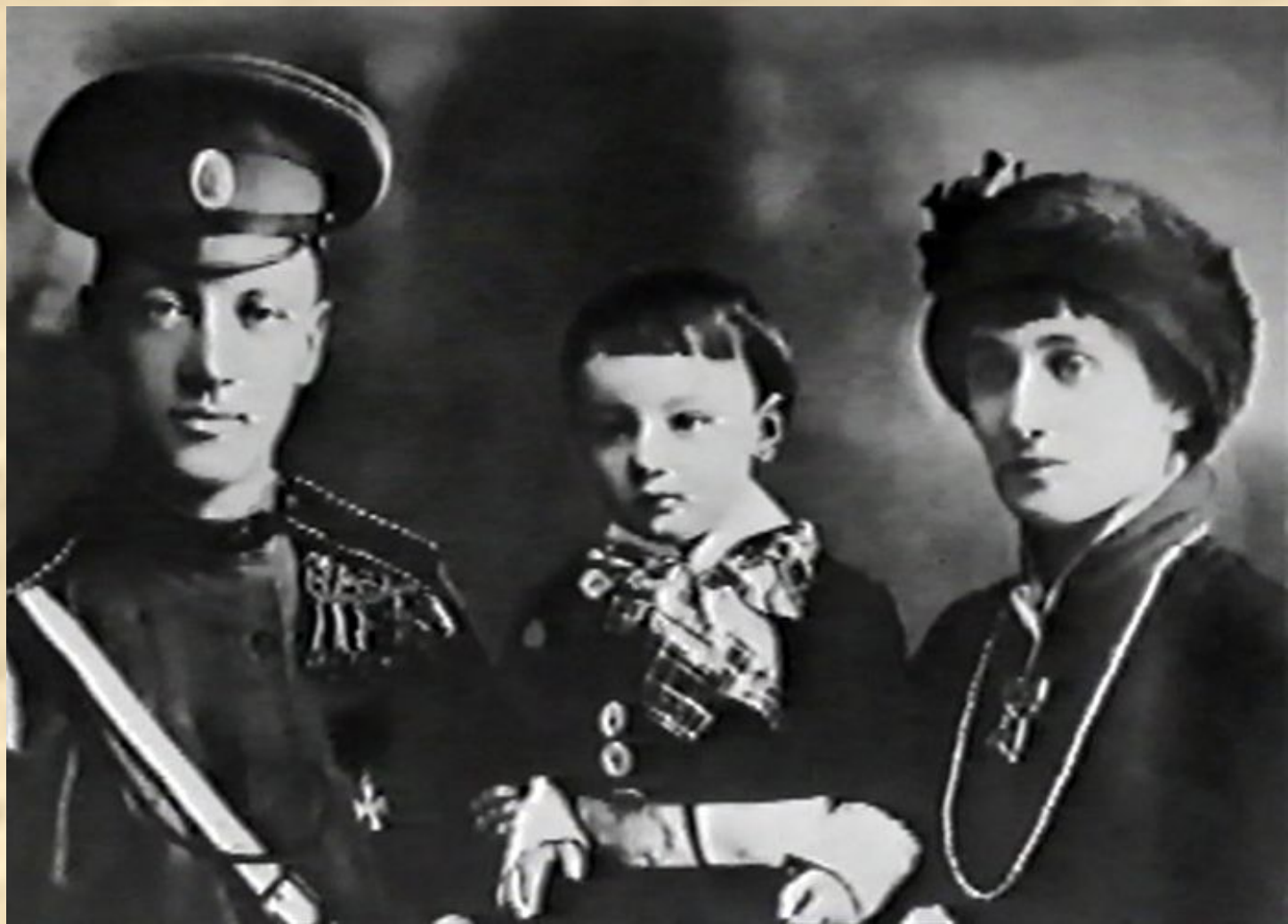
Н.С.Гумилев, Лев Гумилев, А.А.Ахматова. Царское Село. 1916 г.