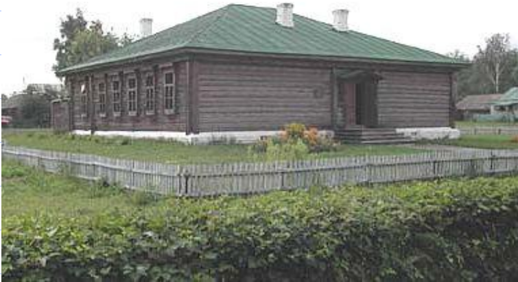
Константиновская земская начальная школа