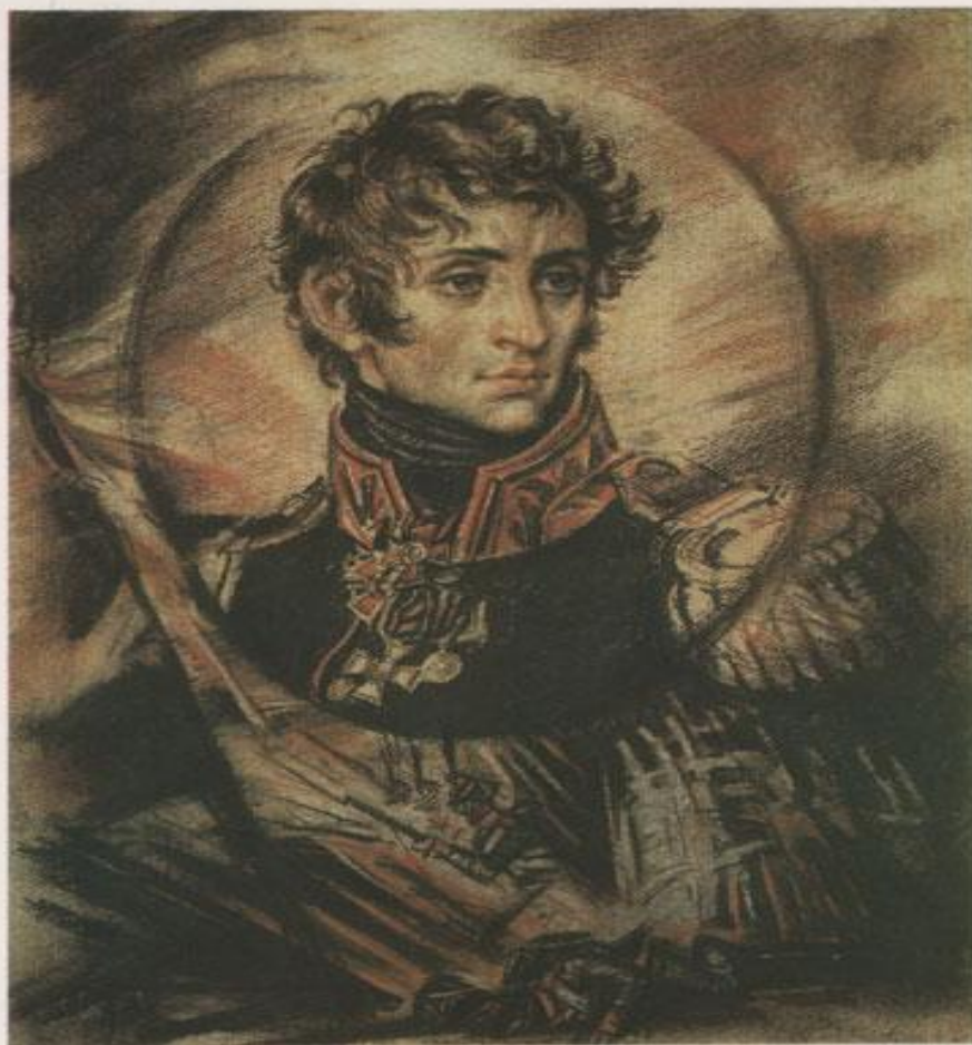
Александр Алексеевич Тучков (4-й) 1777—1812

В одной невероятной скачке Вы прожили свой краткий век!