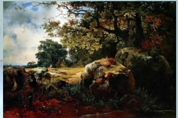
Вид в окрестности Ориенбаума