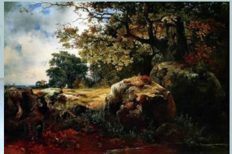
Вид в окрестности Ориенбаума