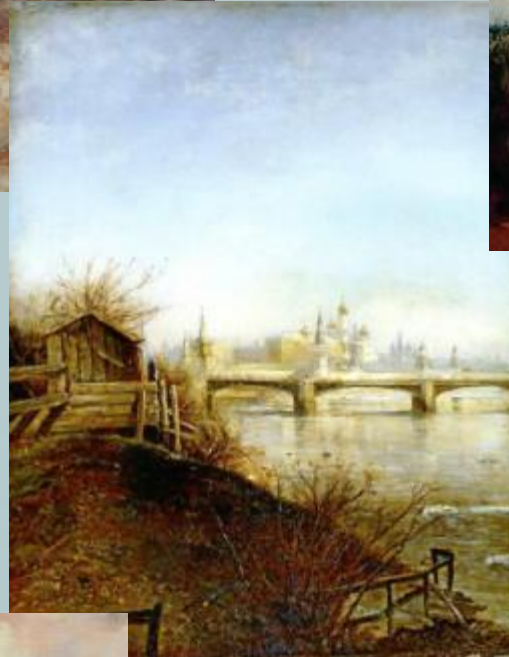
Вид на Кремль с Крымского моста