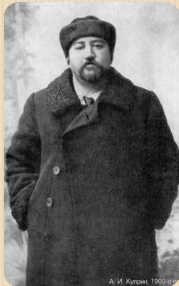
А. И. Куприн. 1900-е гг.