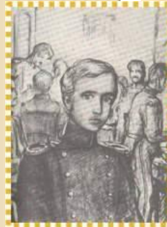
Александр Иванович Куприн