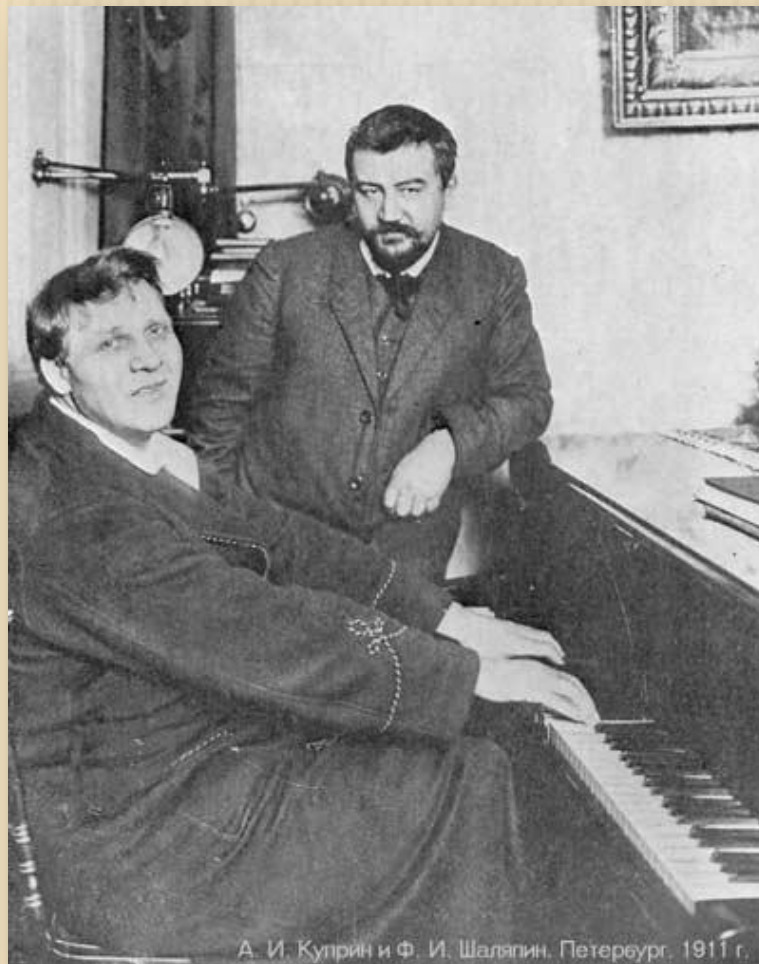
А. И. Куприн и Ф. И. Шаляпин. Петербург. 1911 г.