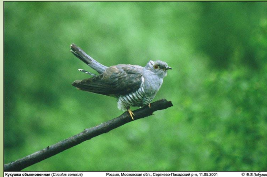
Кукушка обыкновенная ( Cuculus canorus )

Кукушечка, кукушечка, Серенька рябушечка, Прокукуй в лесу: ку-ку – Сколько лет я проживу?