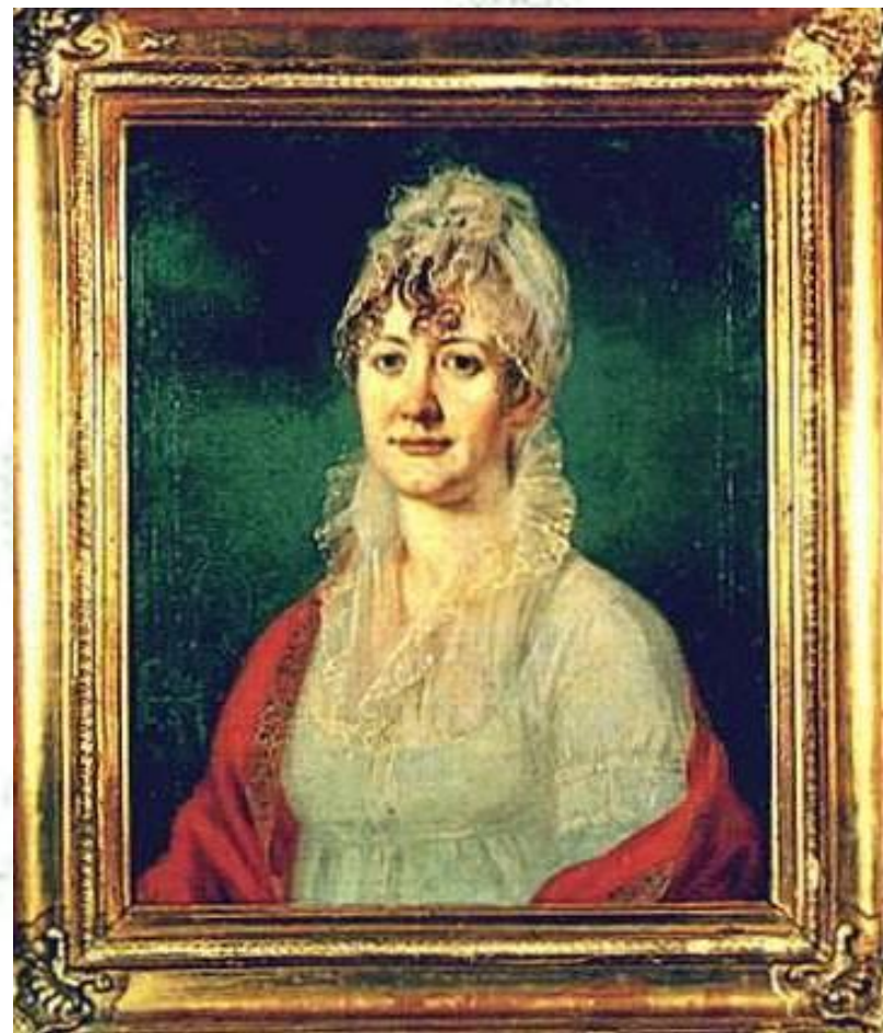
Елизавета Алексеевна Арсеньева, бабушка поэта.

М.Н. Лонгинов, родственник Арсеньевой, оставил в своих воспоминаниях ее портрет: «Она была женщина чрезвычайно замечательная по уму и любезности... Не знаю почти никого, кто бы пользовался таким общим уважением и любовью, Елизавета Алексеевна».