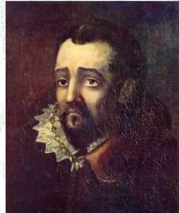
Михаил Лермонтов Картина Лермонтова "Герцог".