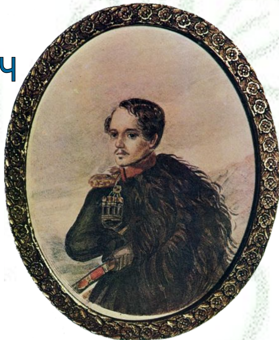
Автопортрет. 1837 - 1838