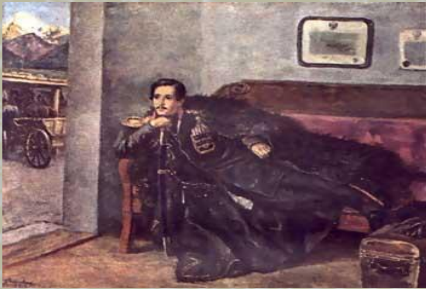
М.Ю.Лермонтов. Художник П.П.Кончаловский.