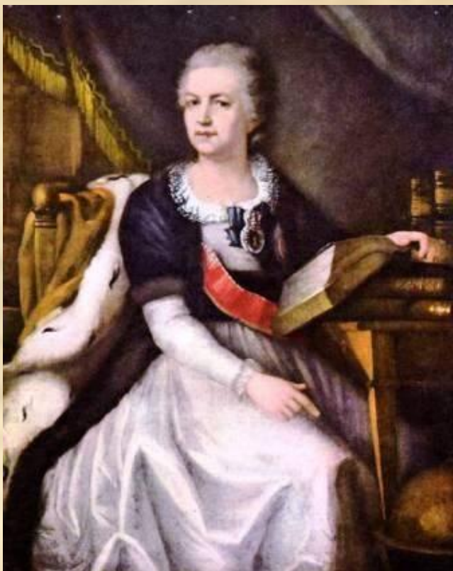
Неизвестный художник. Портрет Е.Р. Дашковой.