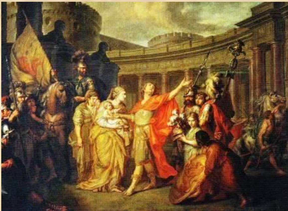
А.П.Лосенко. Прощание Гектора с Андромахой. 1773