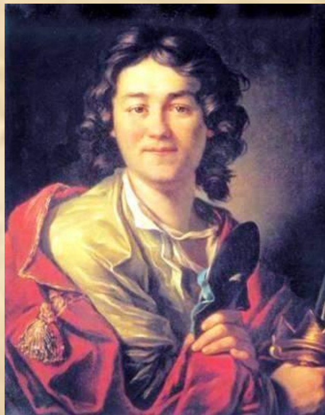
А.П.Лосенко Портрет актёра Ф.Волкова.