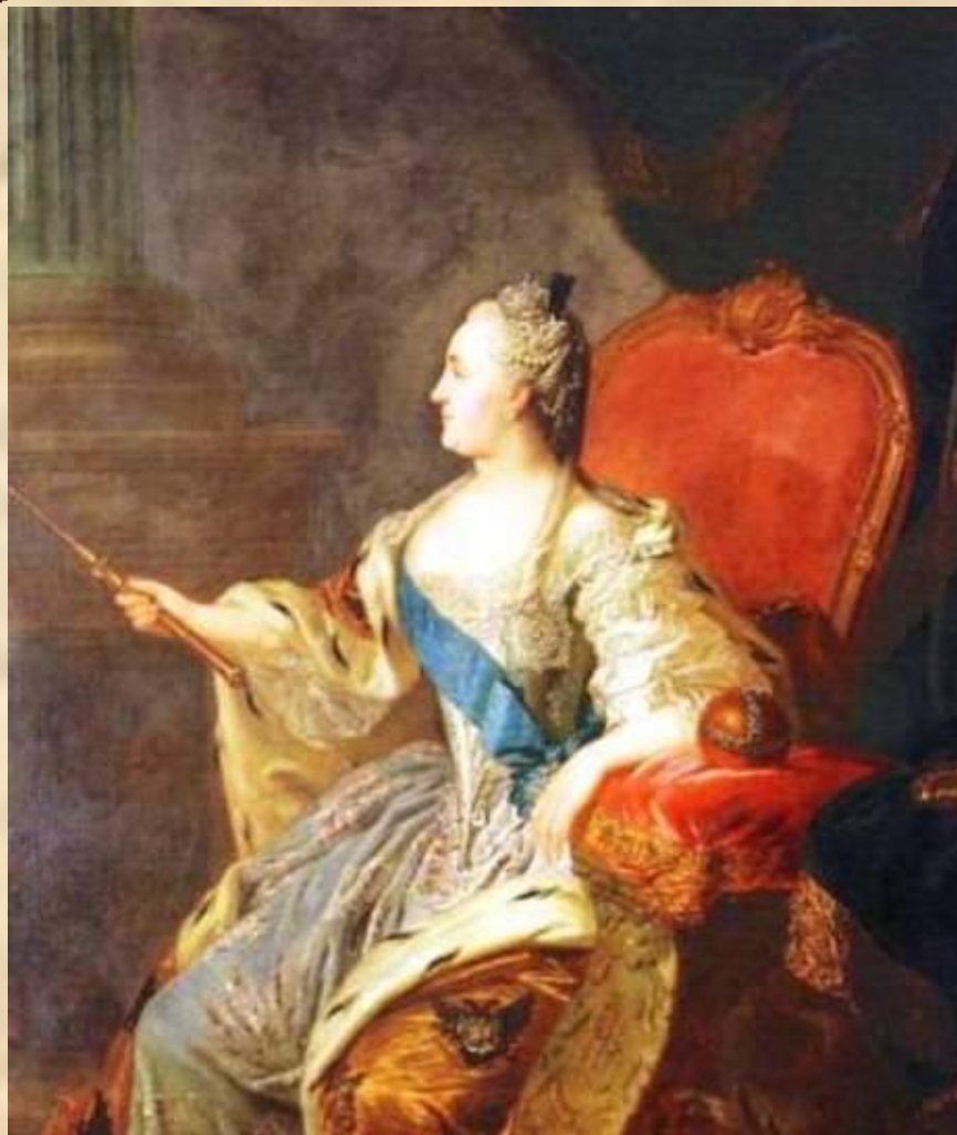
Ф.С.Рокотов. Портрет Екатерины II. 1763