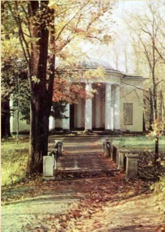
г.Пушкин. Павильон Концертный зал.