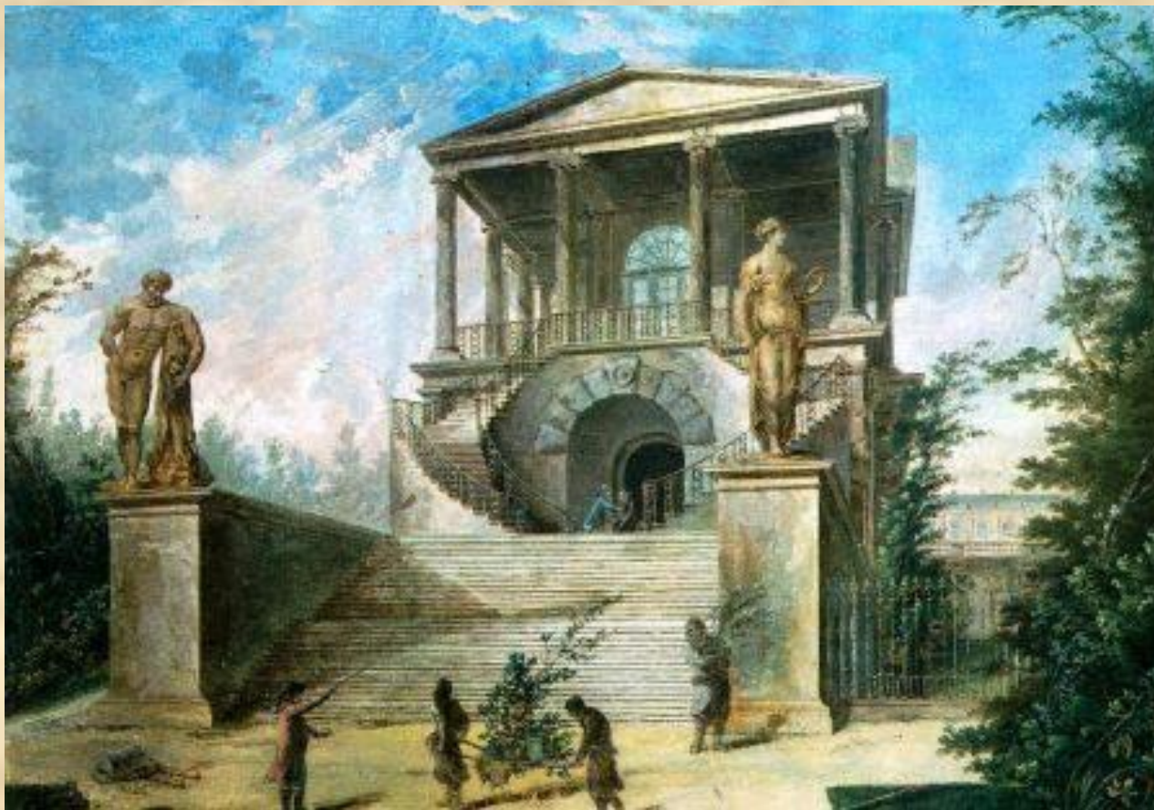
Большой каменный театр.