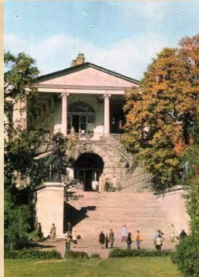
г.Пушкин. Камеронова галерея