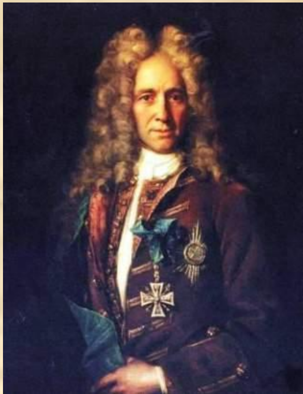
И.Н.Никитин. Портрет канцлера графа Г.И. Головкина. 1720-е