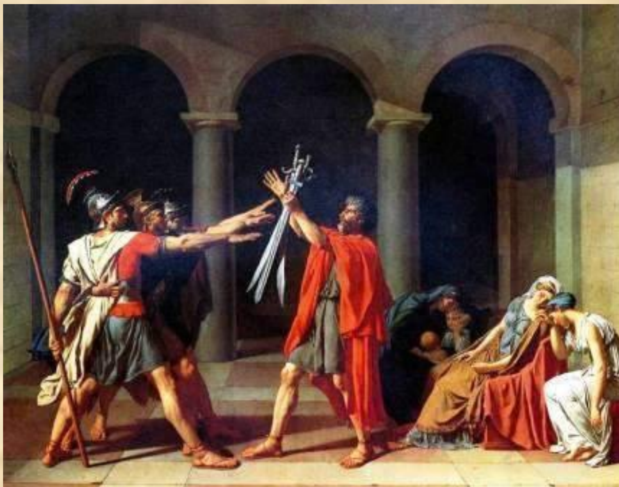
Жак Луи Давид. Клятва Горациев. 1785