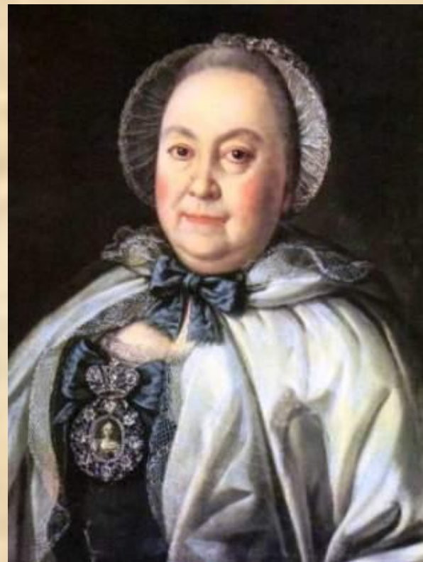
А.П.Антропов. Портрет статс- дамы М.А. Румянцевой. 1764