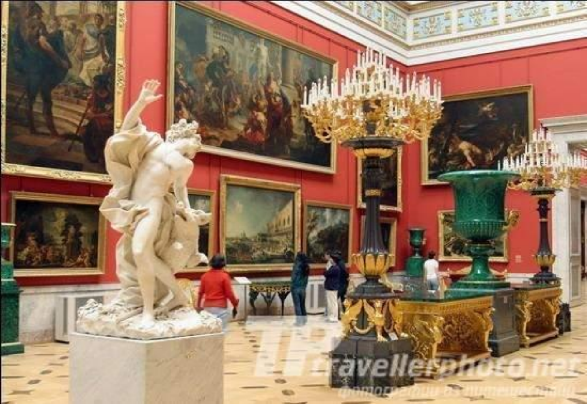
Зал итальянского искусства