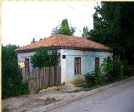
ДОМ-МУЗЕЙ ПАУСТОВСКОГО В ТАРУСЕ"