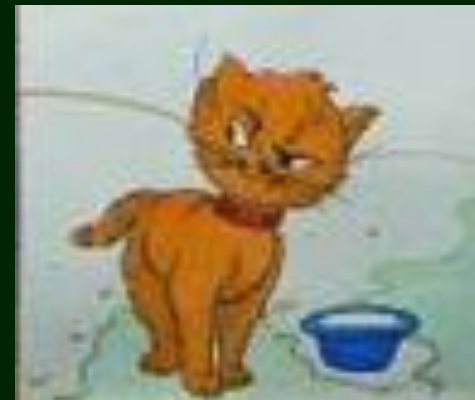
ХОЗЯИН И СТОРОЖ