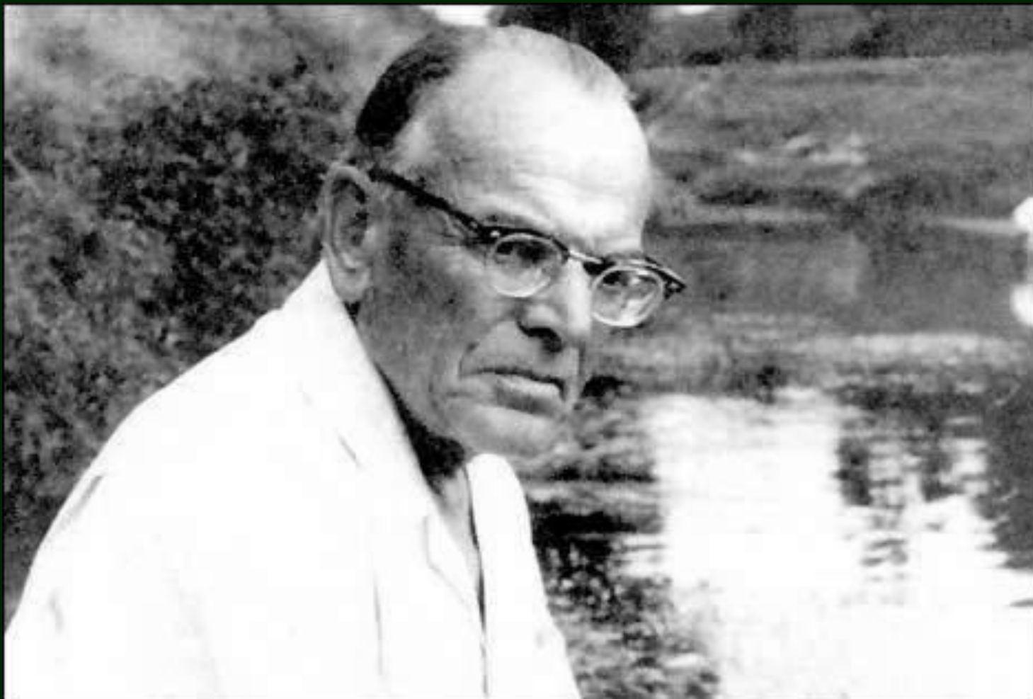
Паустовский Константин Георгиевич