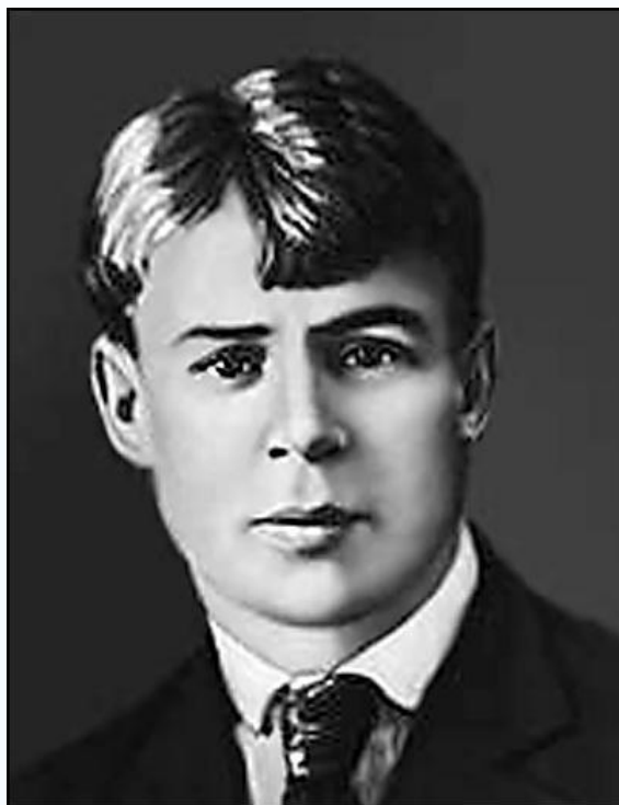
*Сергей Александрович Есенин 1895-1925