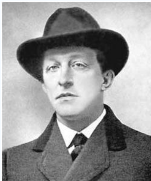
* Александр Александрович Блок 1880-1921