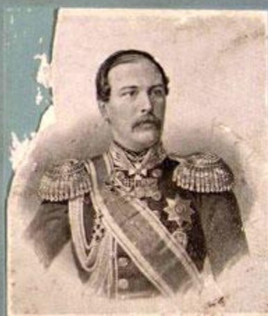
Эдуардъ Ивановичъ Тотлебенъ.

Составить и издать участницъ обороны П. Ф. Рербергъ.