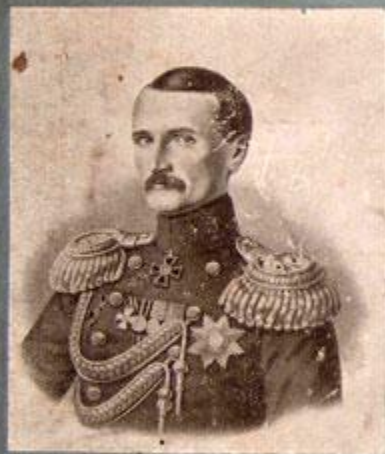
Владимиръ Алексѣевичъ Корниловъ.

Сборник портретовъ участниковъ обороны Севастополя въ 1854—1855 годахъ.