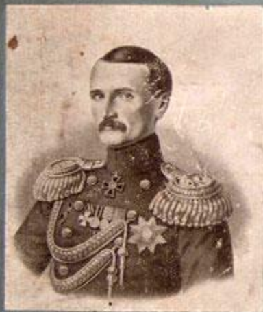
Владимиръ Алексѣевичъ Корниловъ.

Сборник портретовъ участниковъ обороны Севастополя въ 1854—1855 годахъ.