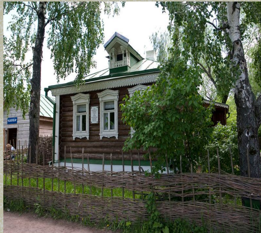
Дом Есенина в Константиново