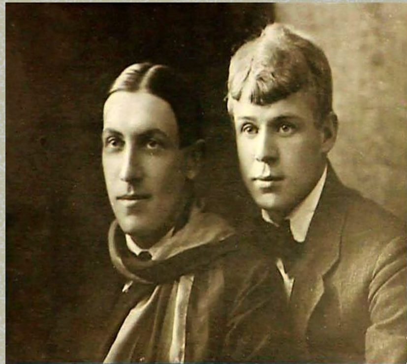
А. Мариенгоф и С. Есенин