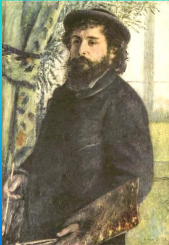
Клод Моне (1840-1926)