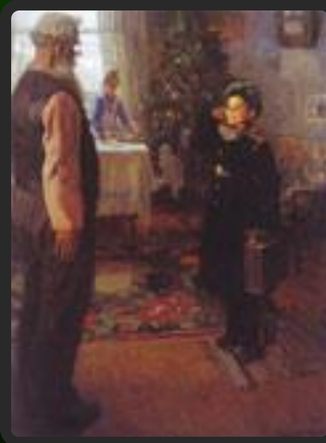
Прибыл на каникулы.