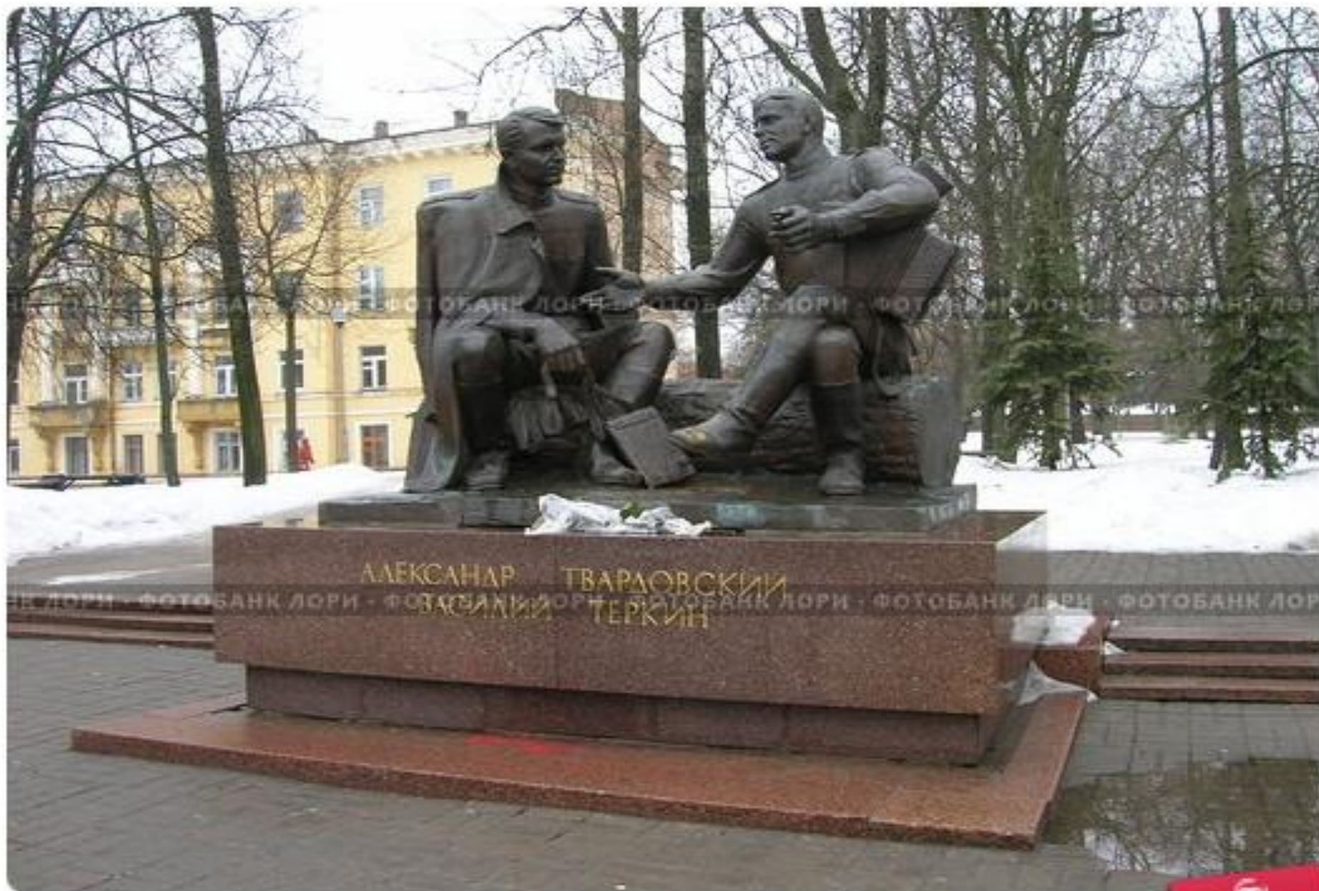
Смоленск. Памятник Александру Твардовскому и Василию Теркину.