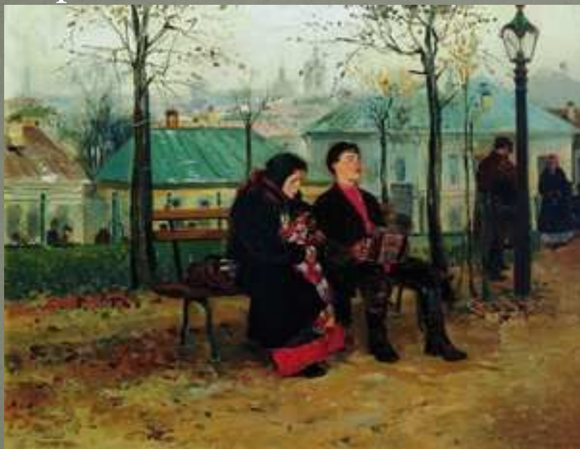
В. Маковский «На бульваре»