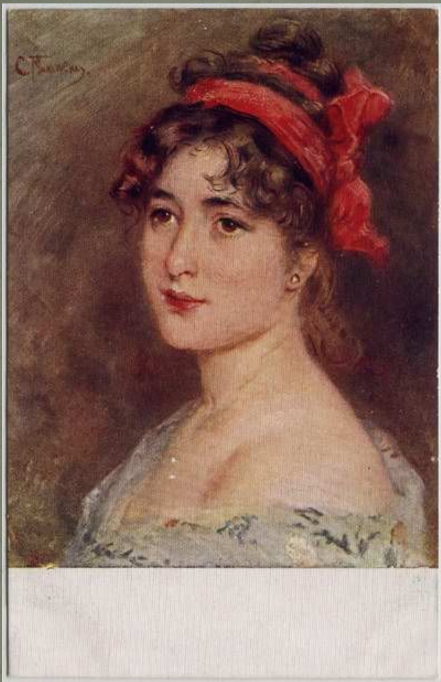
Маковский К. Е. «Головка»

По-разному сложились их творческие судьбы. С давних пор принято считать, что первый из них – блестящий живописец, разменявший свой дар на художественные поделки. «Константин Маковский держал себя большим баринном, ходил, чуть ли не в боярском костюме, выдерживал тон большого, знатного артиста. Зарабатывал большие деньги и умел их проживать. Писал в угоду большой буржуазной публике сладкие ложнорусские сцены, а также бесконечные головки боярышень и в конце стал типичным поставщиком художественного рынка», - утверждал Я. Минченков. Но это не так.