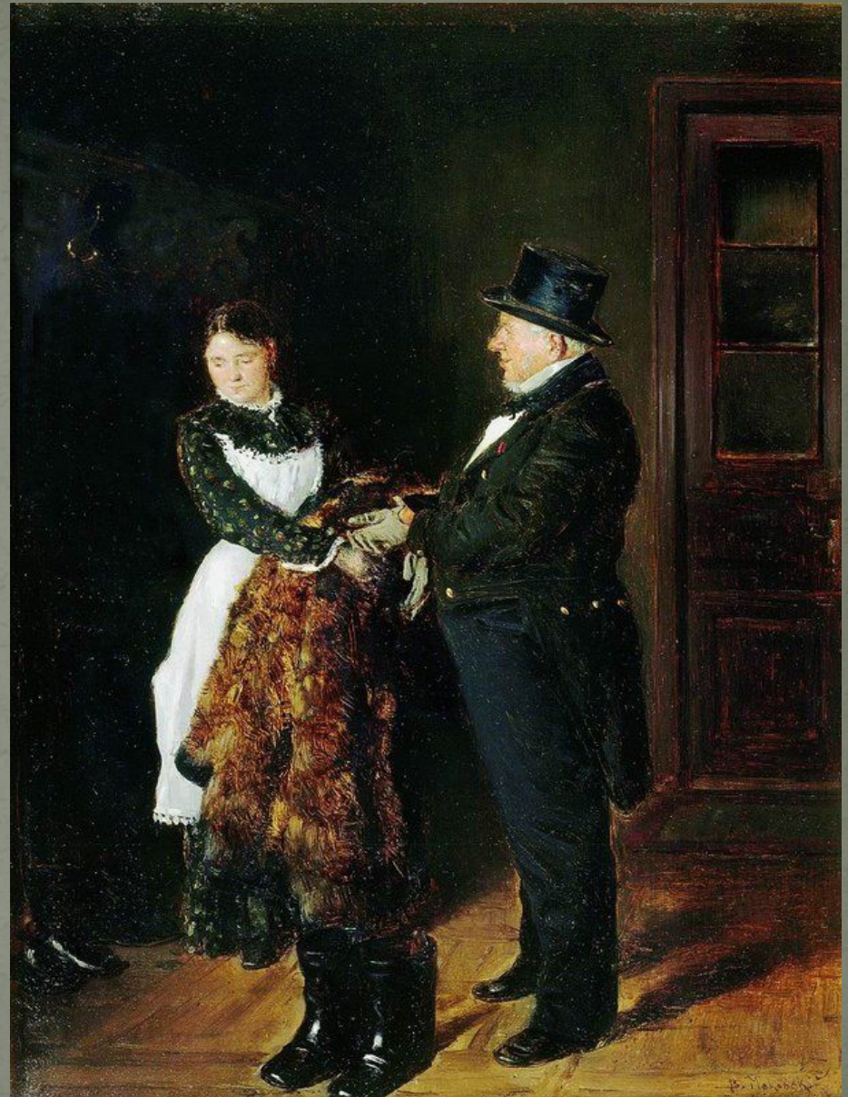
В. Маковский «В передней»