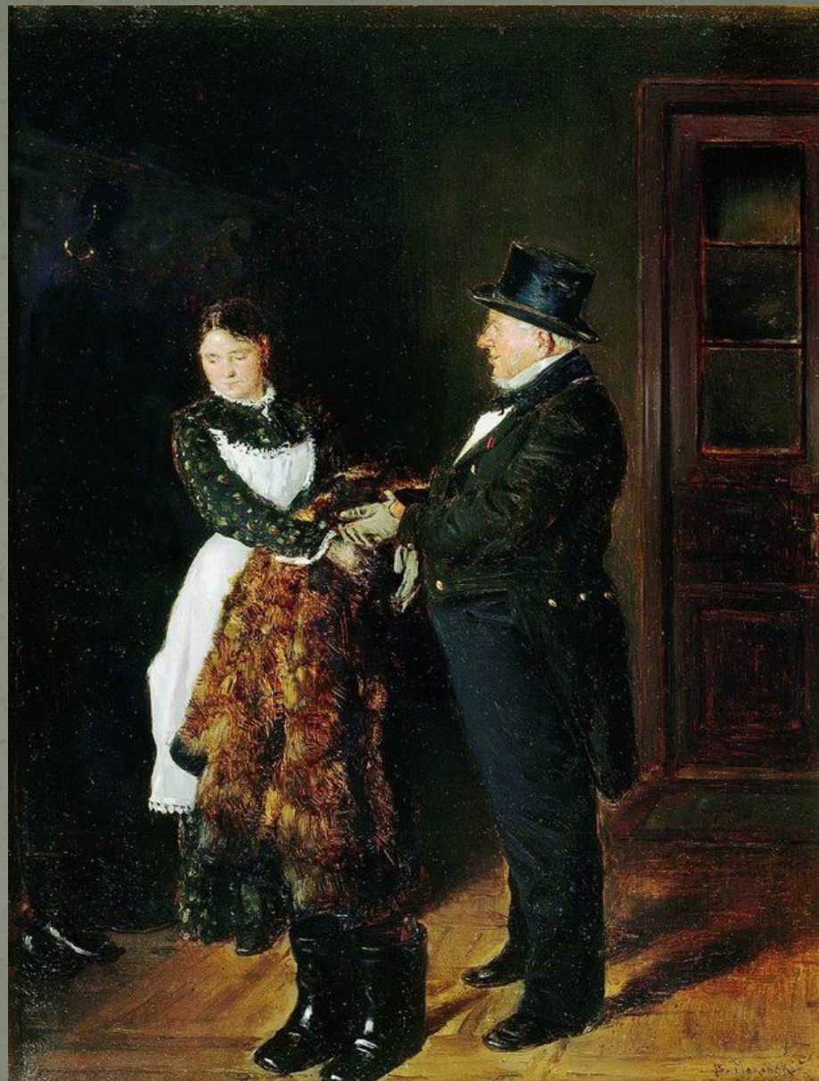
В. Маковский «В передней»