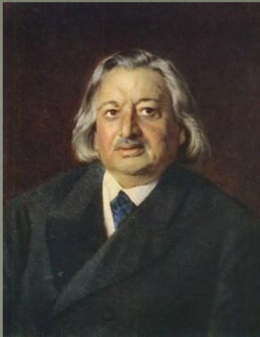
К. Маковский портрет оперного певца Петрова