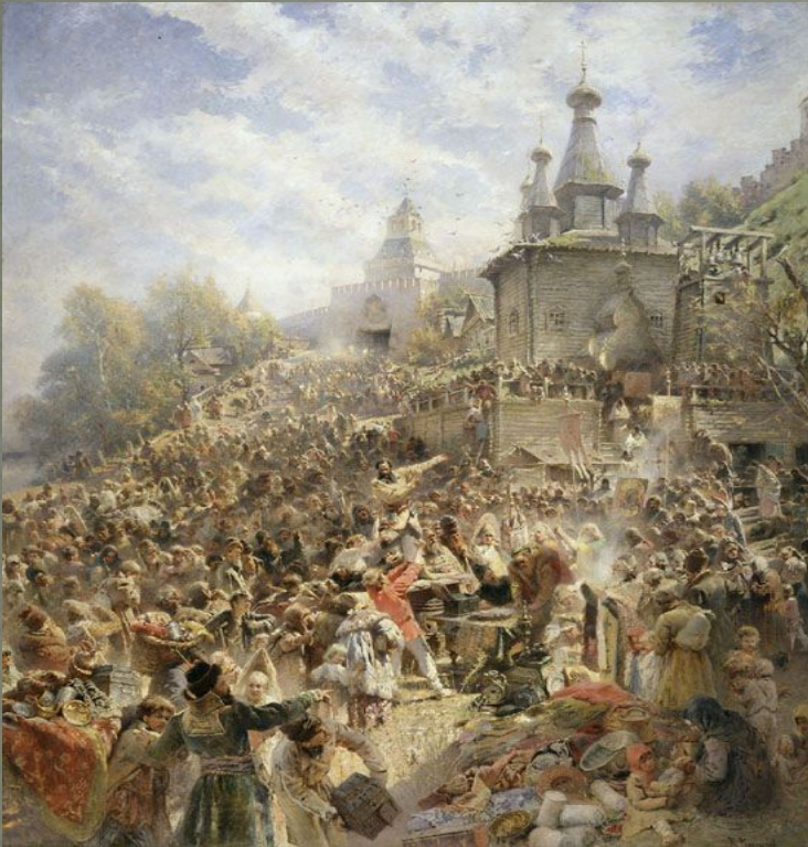
К. Маковский «Воззвание Минина»