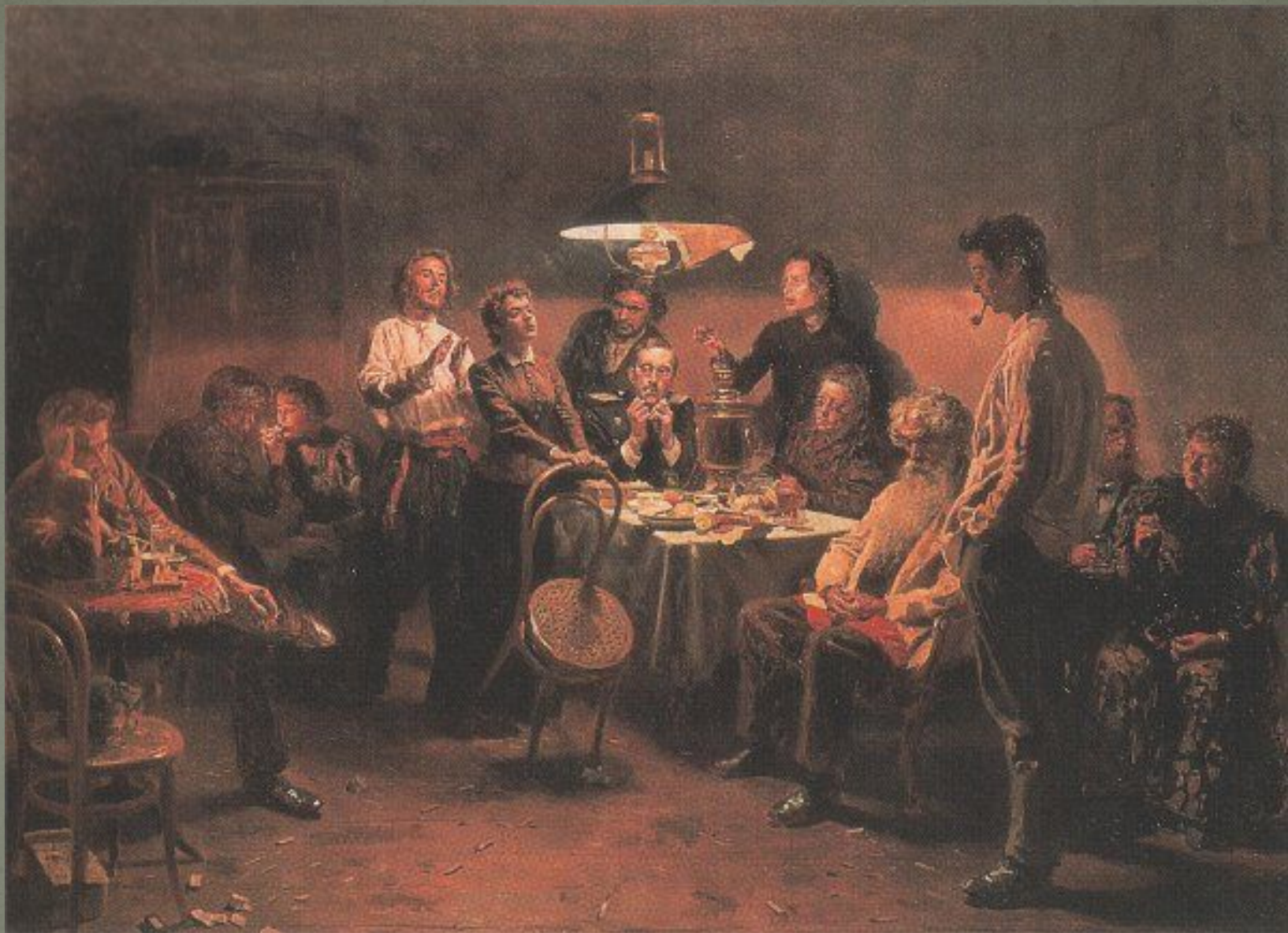
В. Маковский «Вечеринка»