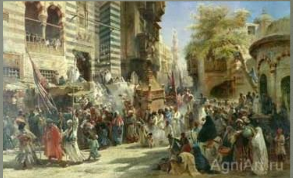
К. Маковский «возвращение священного ковра из Мекки в Каир»