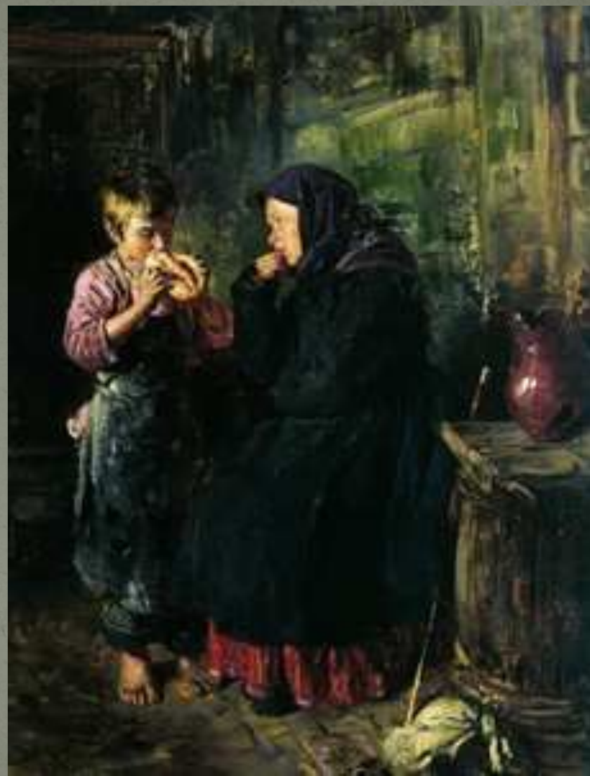
В. Маковский «Свидание»