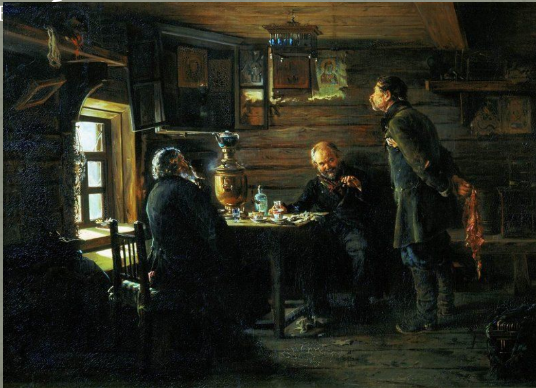
В. Маковский «Любители соловьев»