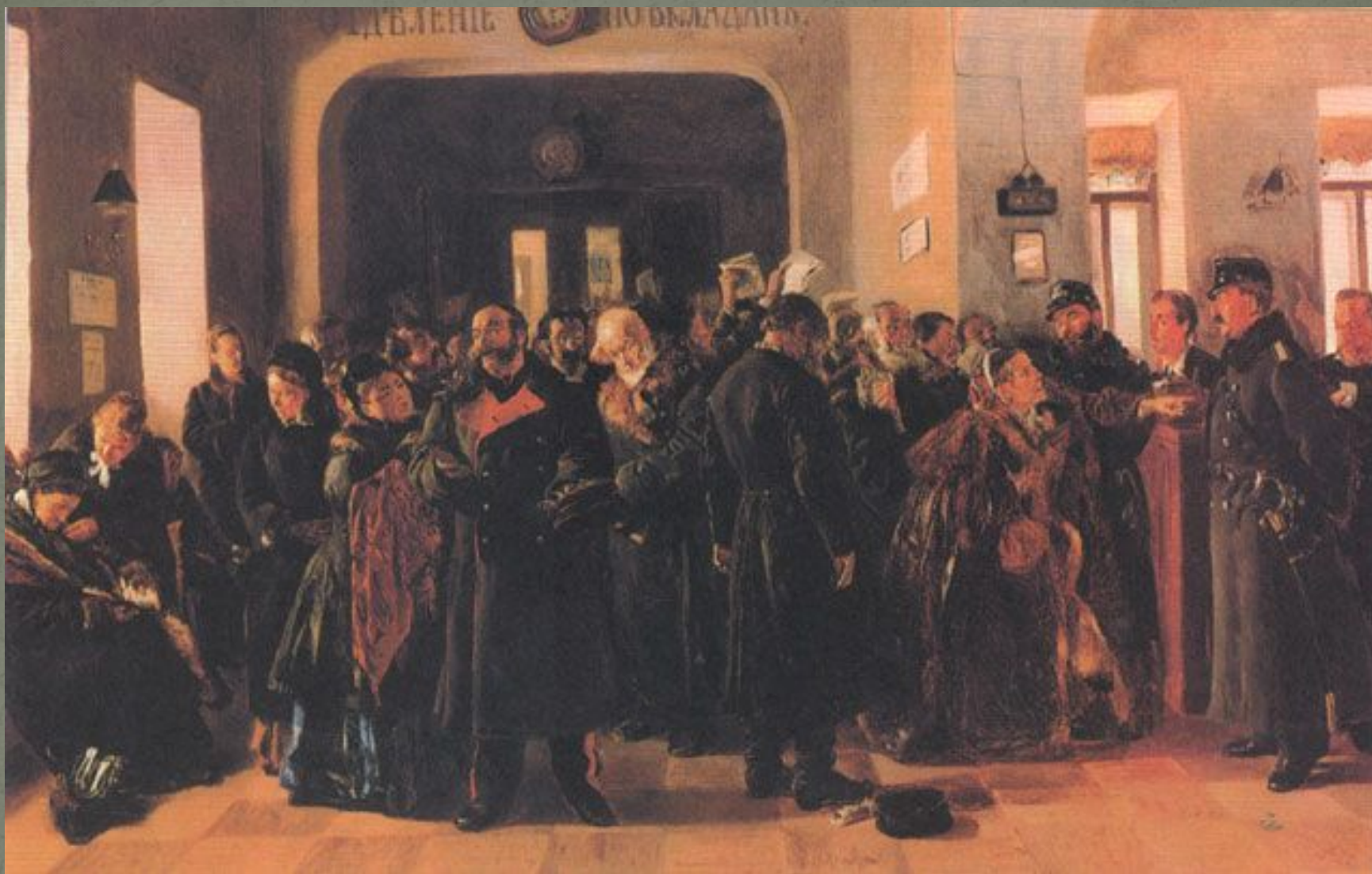
В. Маковский «Крах банка»