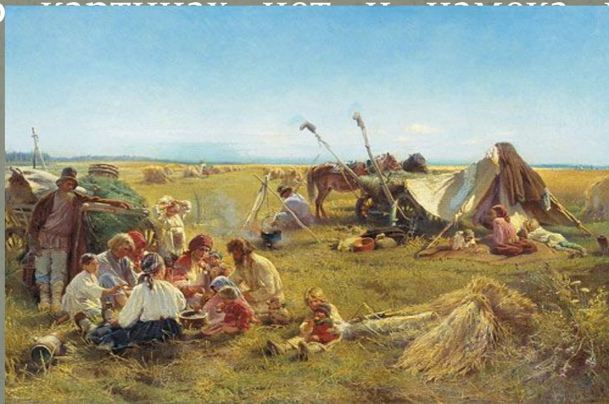
К. Маковский «Крестьянский обед в поле»