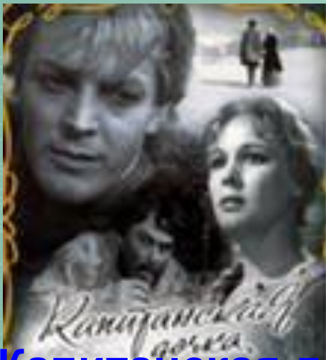
«Капитанская дочка» времени»