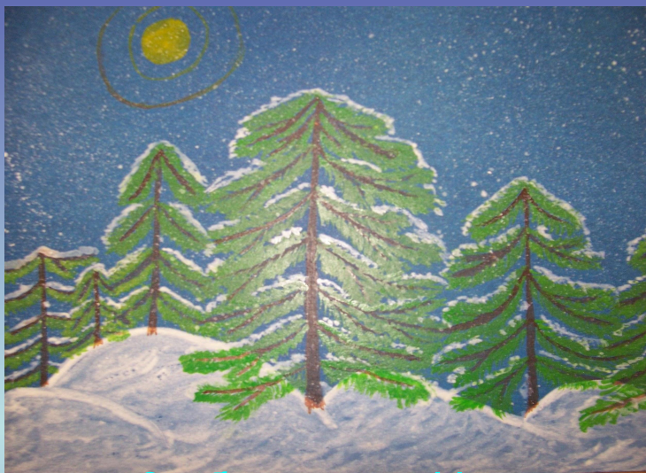
Ученица 2 «б» класса Никаноров Д.