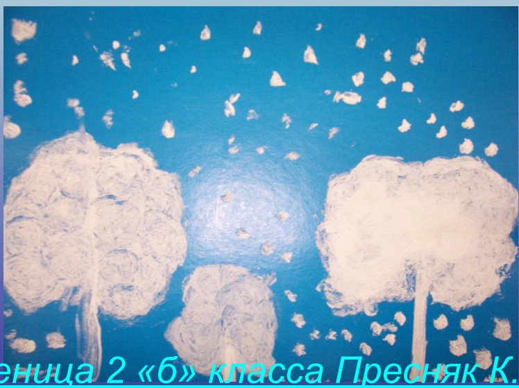
Ученица 2 «б» класса Пресняк К.