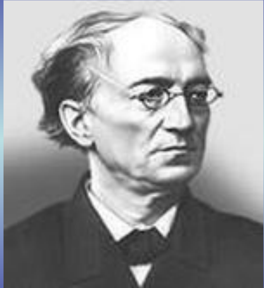
Тютчев Ф.И. (1803-1873)

Солнце зимнее ли мещет На него свой луч косою — В нем ничто не затрепещет, Он весь вспыхнет и заблещет Ослепительной красой.