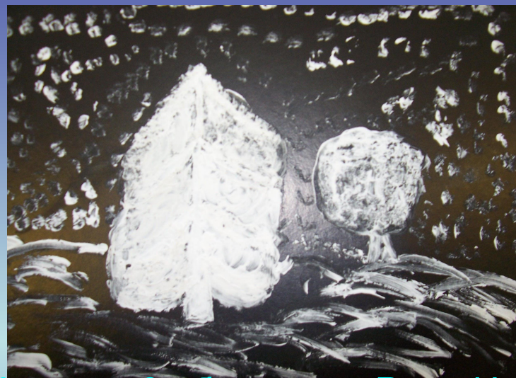
Ученица 2 «б» класса Репп И.