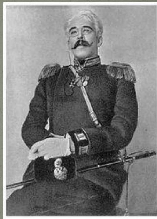
Станиславский в роли Вершинина.

Работу над спектаклем в Художественном театре начинал К. С. Станиславский, — снова, как и в предыдущих постановках, ключом к спектаклю для него стало «раздвоение мира», «противоречие поэзии и прозы». По собственному признанию режиссёра, работа шла тяжело, и был момент, когда пьеса «не звучала, не жила, казалась скучной и длинной»