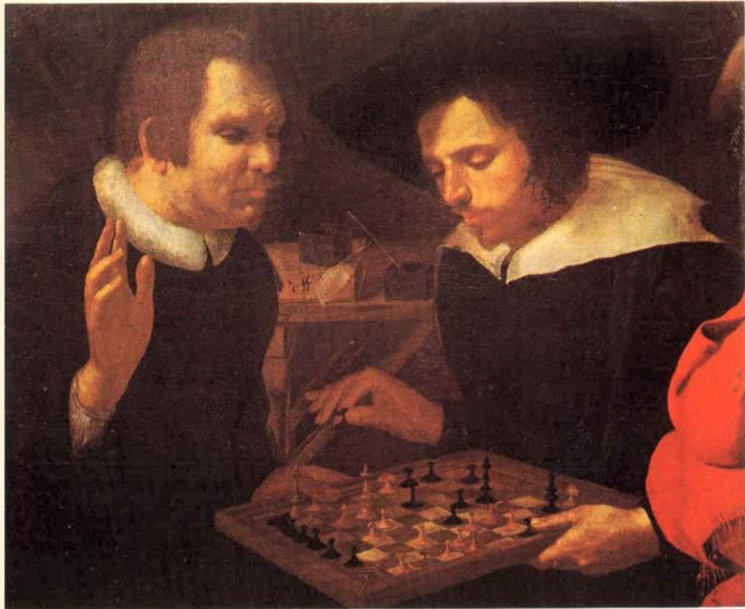
Бен Джонсон и Уильям Шекспир