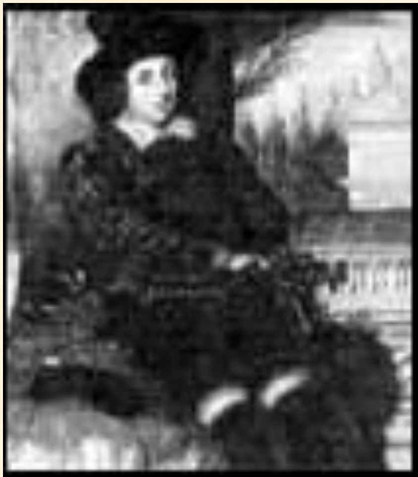
Роджер Мэннерс, граф Рэтленд

К. Блейбтрей, Ф. Шипулинский, А. Луначарский, И. Гилилов