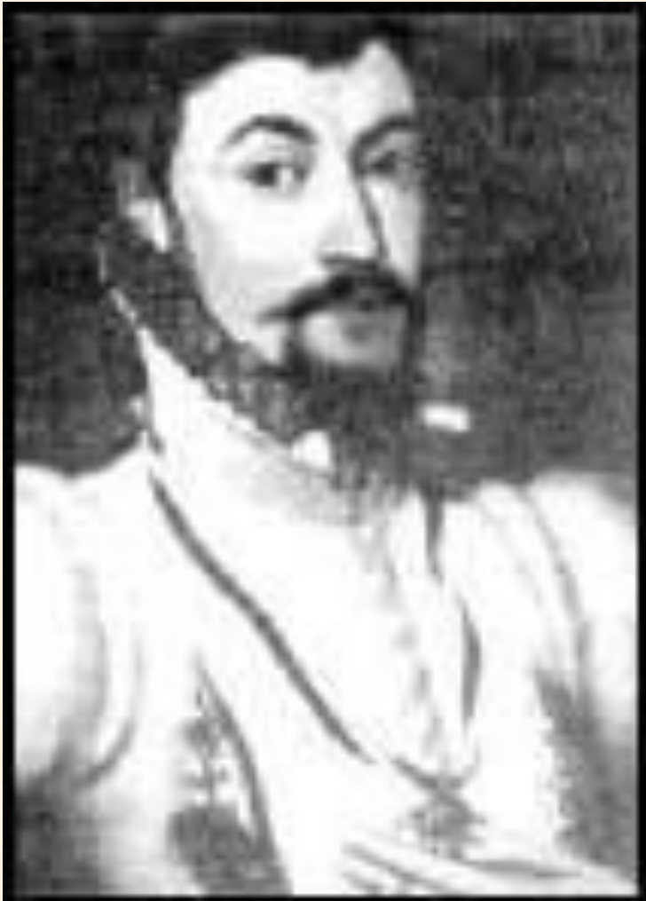
Эдуард де Вер, граф Оксфорд