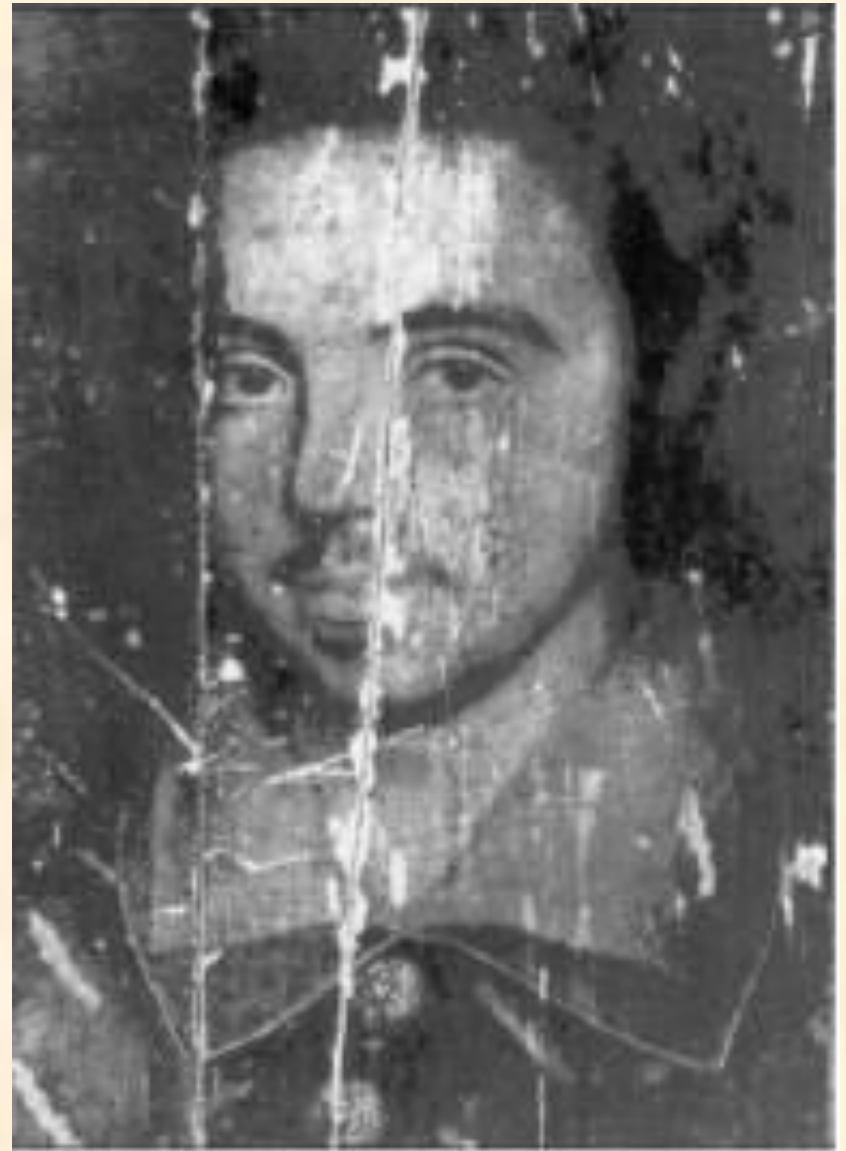
К. Марло, 1585