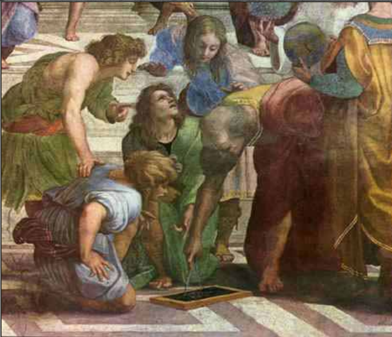
Рафаэль Санти, Евклид, деталь 1508-11, фреска "Афинская школа" Станц делла Сеньятура, Ватикан, Рим, Италия