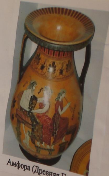
Амфора (Древняя Греция)

В древней Греции и Риме на посуде изображали людей, богов, животных, корабли, предметы быта. Они располагались в центре. Края посуды украшали сложными геометрическими узорами.