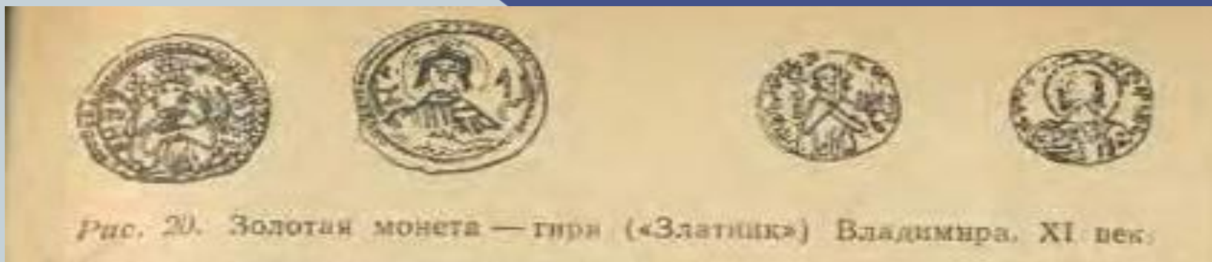
Рис. 20. Золотая монета — гиря («Златник») Владимира, XI век.

Гиря «Златник» Владимира – это золотая монета, весом 4 грамма. На лицевой стороне монеты – изображение великого князя в головном уборе с жезлом в руке и круговая надпись: «Владимир а се его злато» или «Владимир на столе». На оборотной стороне – поясное изображение с надписью «Иисус Христос». Серебряная гирька: на лицевой стороне – изображение почти такое же, как и на золотой монете и те же надписи. На оборотной стороне – окончание надписи с лицевой стороны и особый знак. Медная гирька князя Глеба (XII век), найденная в киевских пещерах при обвале стен. Вес этой гирьки 516,5 долей.