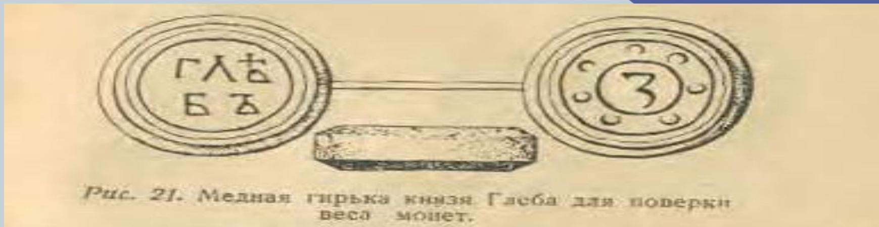
Рис. 21. Медная гирька князя Глеба для проверки веса монет.