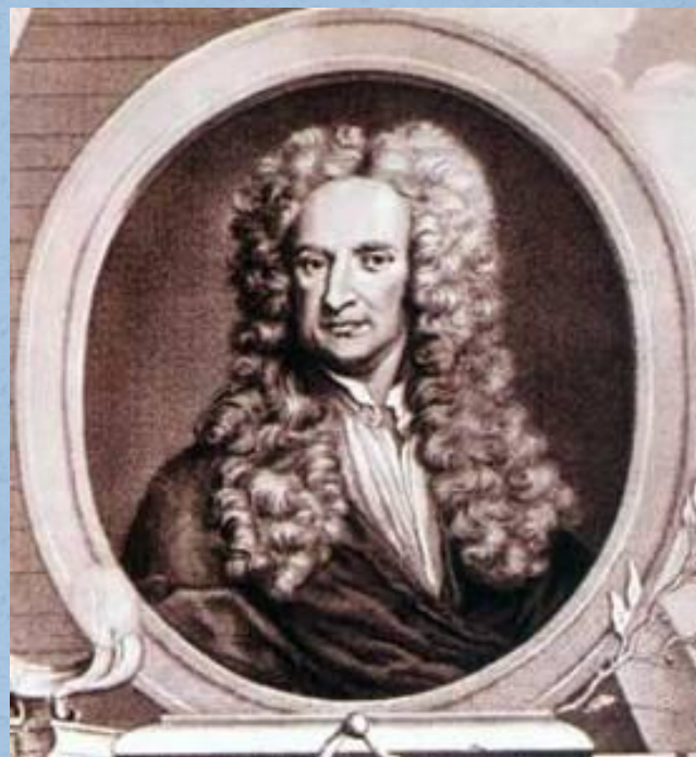
Исаака Ньютона (1643–1727)