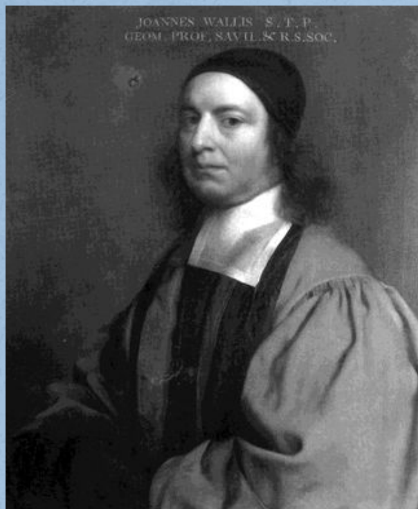
Джона Валлиса (1616–1703)

Современные определения и обозначения степени с нулевым, отрицательным и дробным показателем берут начало от работ английских математиков.