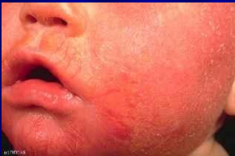
Рис. 3. Эритема: 3 балла