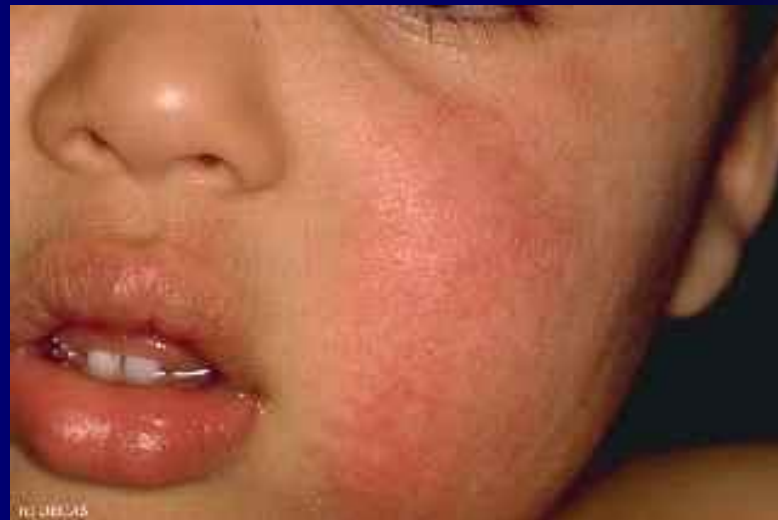
Рис. 2. Эритема: 2 балла