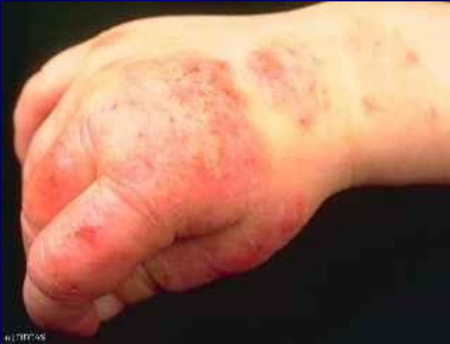
Рис. 1. Отек, папулообразование