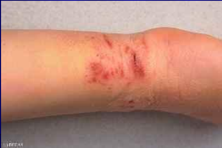
Рис. 3. Экскориации: