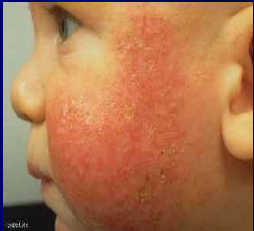
Рис 2. Мокнутие, корки: