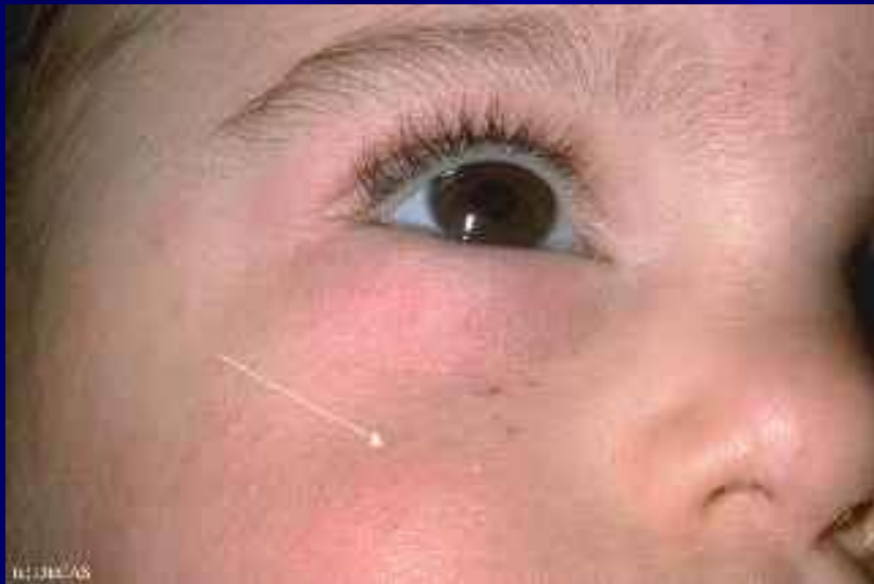
Рис 1. Эритема: 1 балл