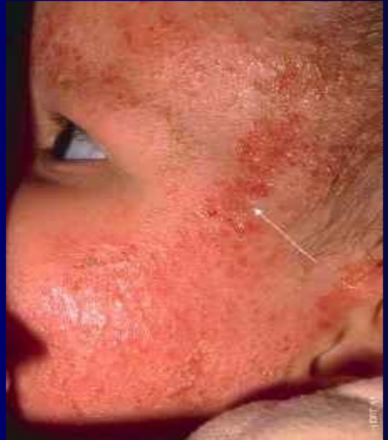
Рис. 2. Мокнутие, корки: