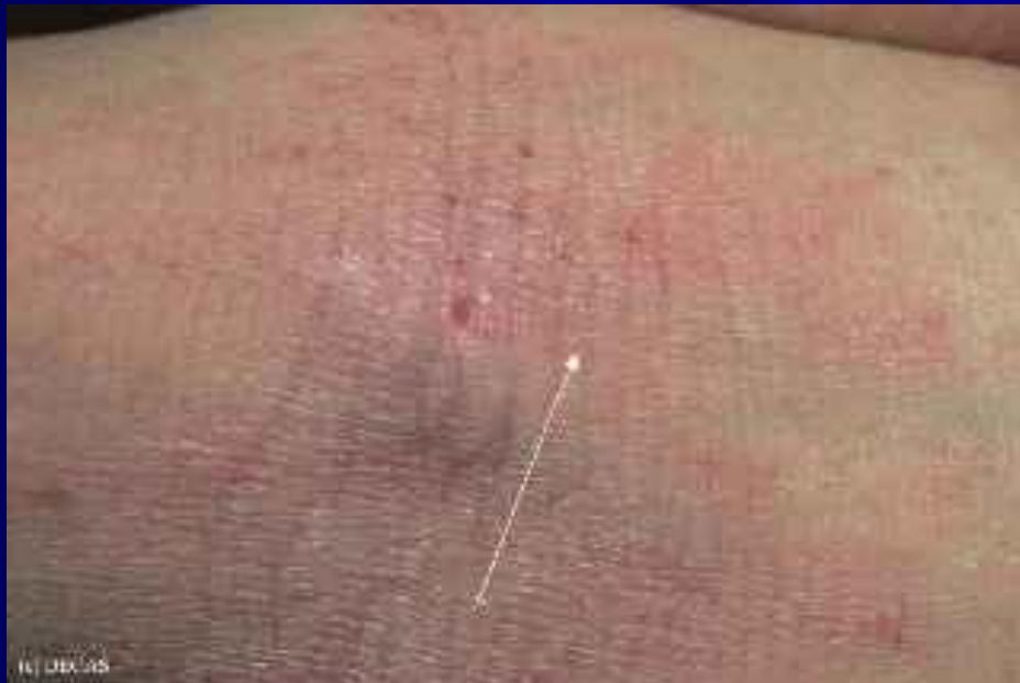
Рис. 1. Лихенификация