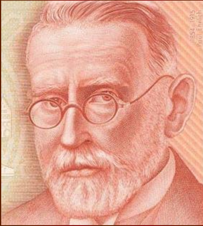
Пауль Эрлих. Портрет на банкноте в 200 марок 1996 г.

Прозорливость Эрлиха поражает, поскольку с некоторыми изменениями эта в целом умозрительная теория подтвердилась в настоящее время.