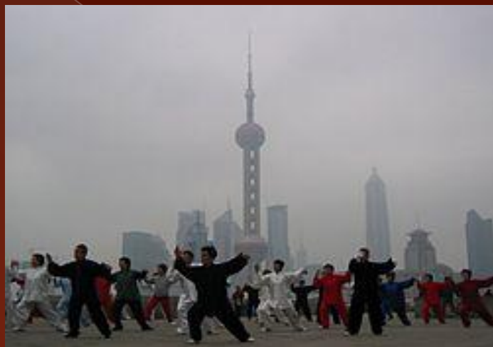
Гимнастика тайцзы-цюань в Шанхае