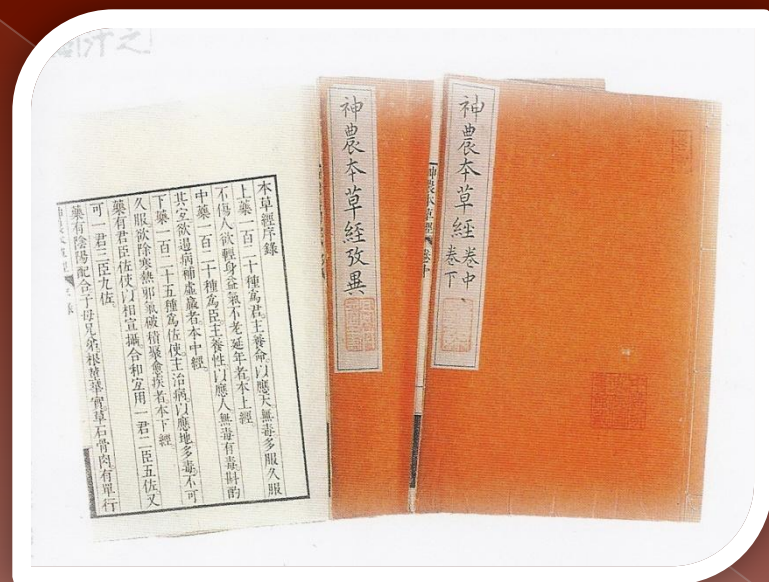
«Трактат о корнях и травах Шэньнуна» (приблизительно 2 век до н.э.