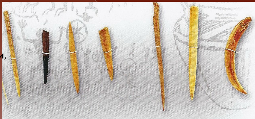
Древние хирургические иглы и шила из кости, эпоха неолита (приблизительно 6000-2000 гг. до н.э.)