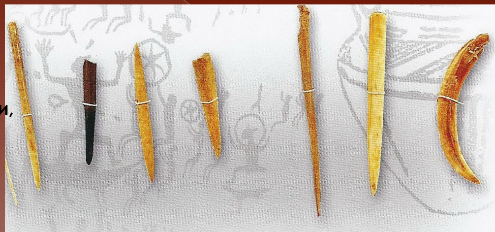
Древние хирургические иглы и шила из кости, эпоха неолита (приблизительно 6000-2000 гг. до н.э.)