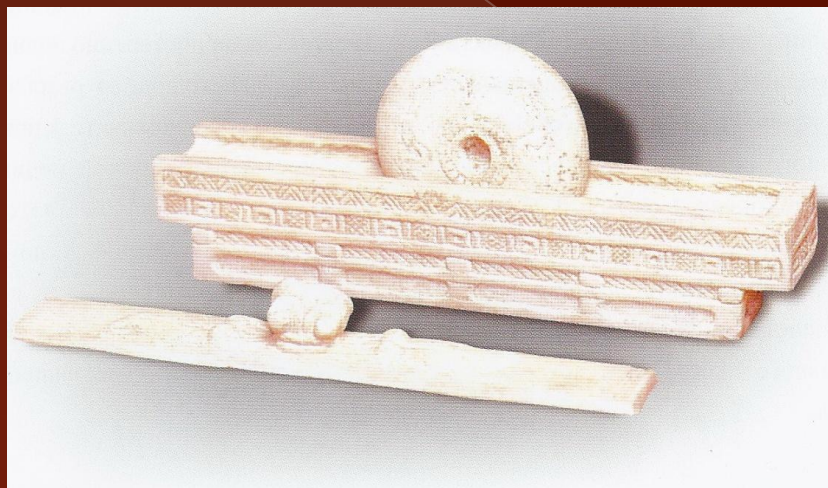
Приспособление для измельчения Белого мрамора, династия Тан (618-907 гг. до н. э.