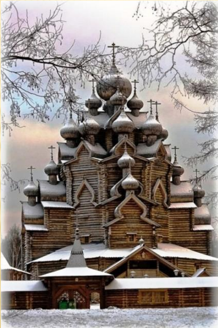
Преображенская церковь в Кижях

Вершиной древнерусского деревянного зодчества стали многоглавые церкви. Русские плотники, передававшие строительный опыт из поколения в поколение, по-новому осмысливали уже освоенные формы и разрабатывали выразительнейшие в художественном и строительном отношении композиции. Различные по высоте и силуэту, церкви Кижского погоста составляют единую живописную группу.