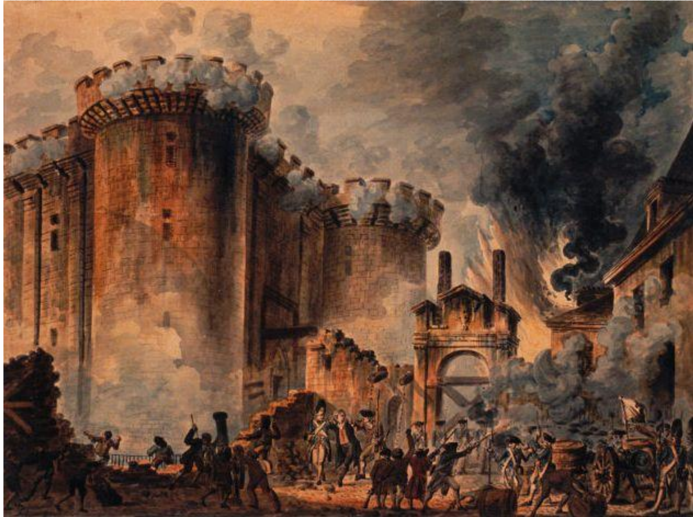
Рис.1 «Взятие Бастилии 14 июля 1789», Жан-Пьер Уэль

Великая Французская революция (1789—1799 гг.), уничтожившая монархию и установившая республику, надолго определила пути развития европейской культуры.