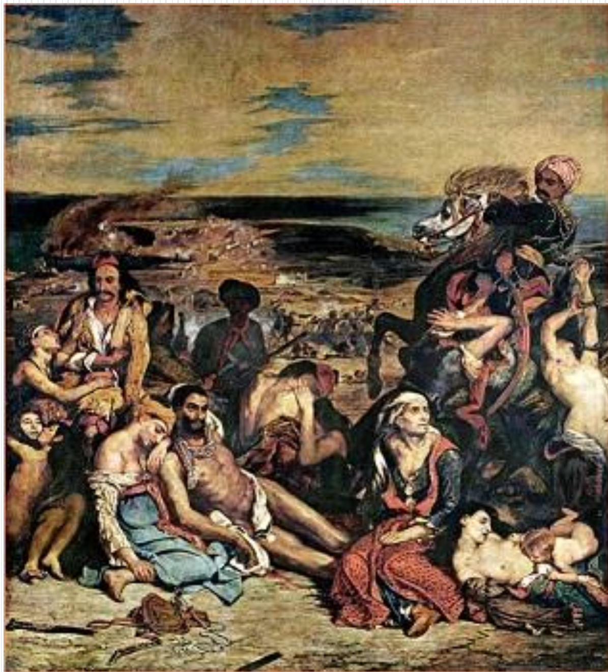
Рис.5 Делакруа Э. «Резня на Хиосе»

Нередко творения романтиков шокировали общество полным неприятием господствовавших вкусов, небрежностью, незавершённой. Знаменитый французский живописец Эжен Делакруа, лидер романтизма, утверждал, что искусство «даёт только намёк, является лишь мостом между душою художника и душою зрителя».