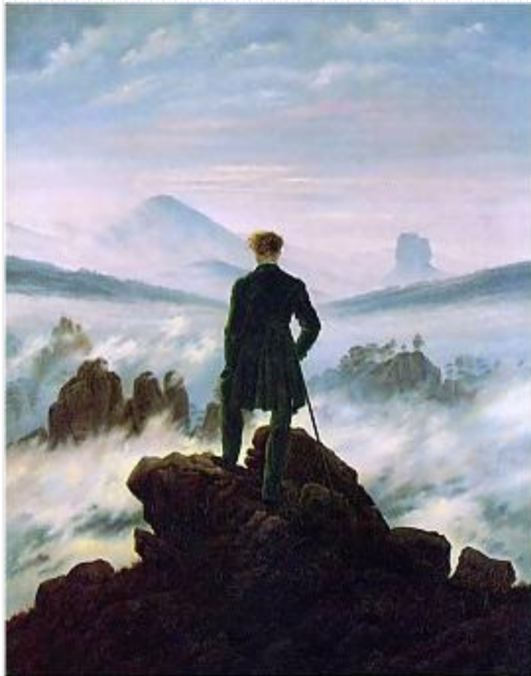
Рис.3 «Странник над морем тумана». Каспар Давид Фридрих, 1818.

Мир романтиков таинствен, противоречив и безграничен; художник должен был воплотить его многообразие в своём творчестве. Основное в романтическом произведении — чувства и фантазия автора. Для художника романтика не было и не могло быть законов в искусстве: ведь всё, что он создавал, рождалось в глубине его души. Единственное правило, которое он чтит, — это верность себе, искренность художественного языка.