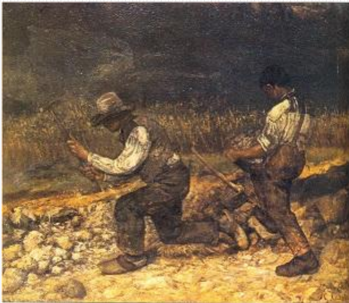
Рис.7 Курбе Г. «Дробильщики камня»

Распознаем критический реализм, романтический реализм.