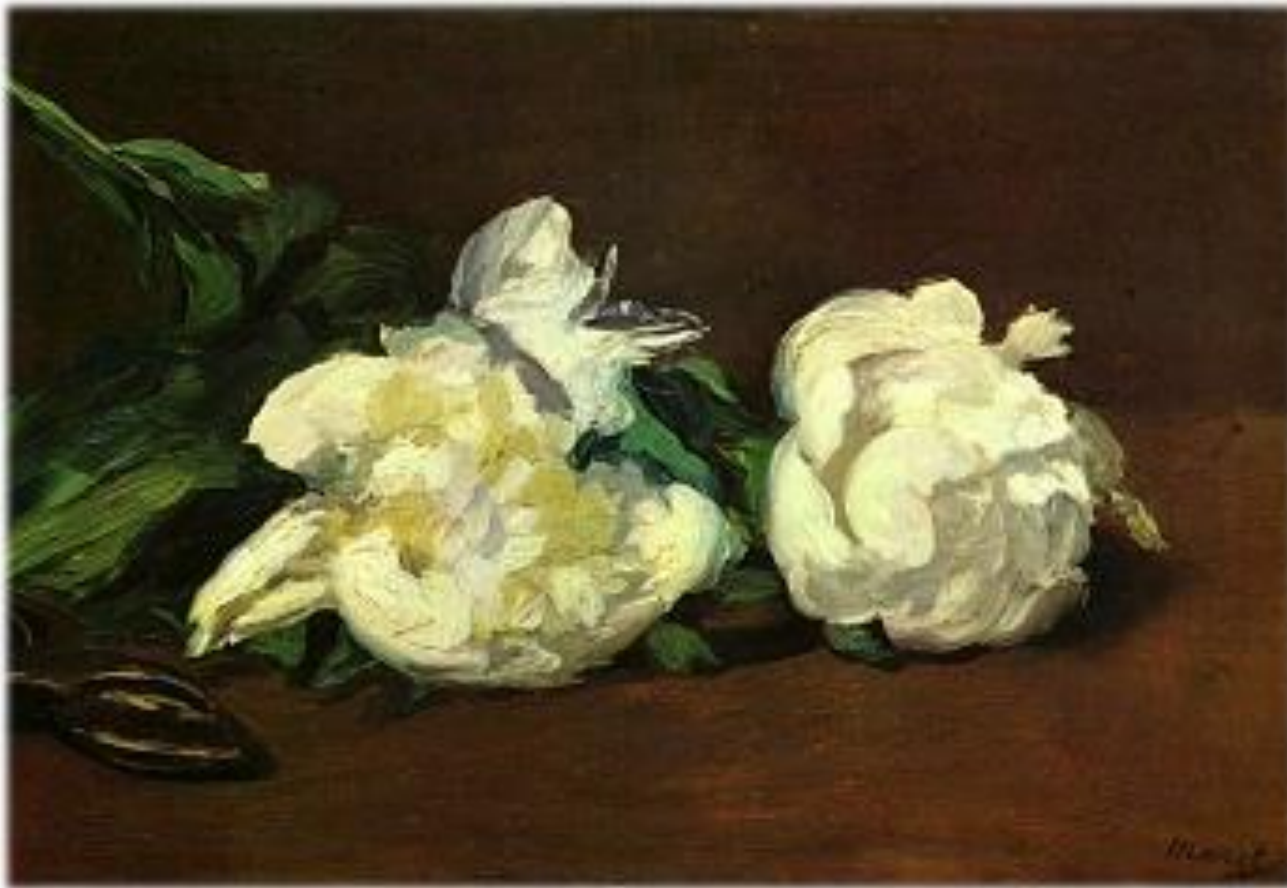
Рис.10 Мане Э. «Белые пионы.» 1864

Живопись мгновения, впечатление для глаз. Трепещущий от солнца и воздуха цвет. Импрессионисты ввели и новую живописную технику, отказались от смешанных цветов, начали писать чистыми яркими красками, густо нанося их отдельными мазками (при восприятии, оптически смешиваясь, для зрителя они давали нужный тон). Самые известные художники этого направления живописи: Мане, Ренуар, Сезанн, Дега, Моне, Писсарро.