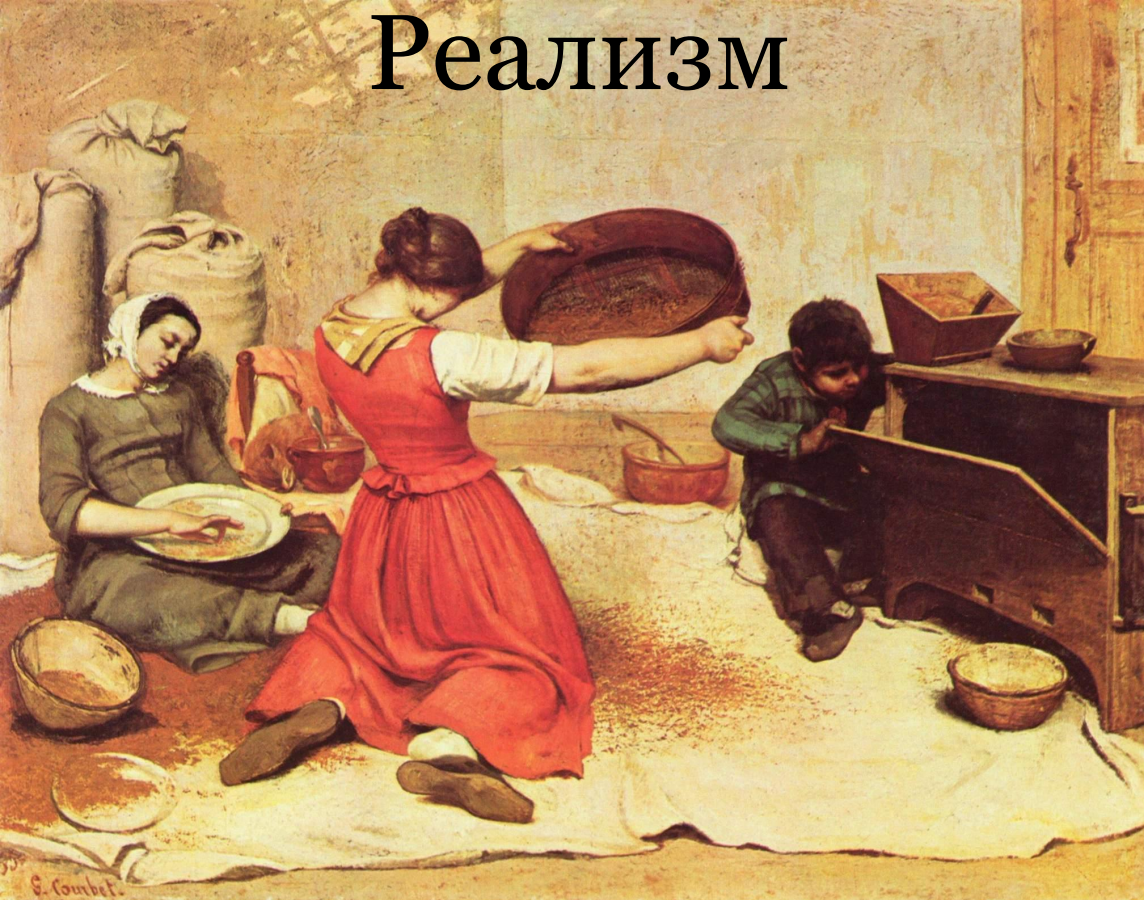
Рис.6 Курбе Г. «Веяльщицы», 1853

Рождение реализма чаще всего связывают с творчеством французского художника Гюстава Курбе (1819—1877), открывшего в 1855 г. в Париже свою персональную выставку «Павильон реализма».