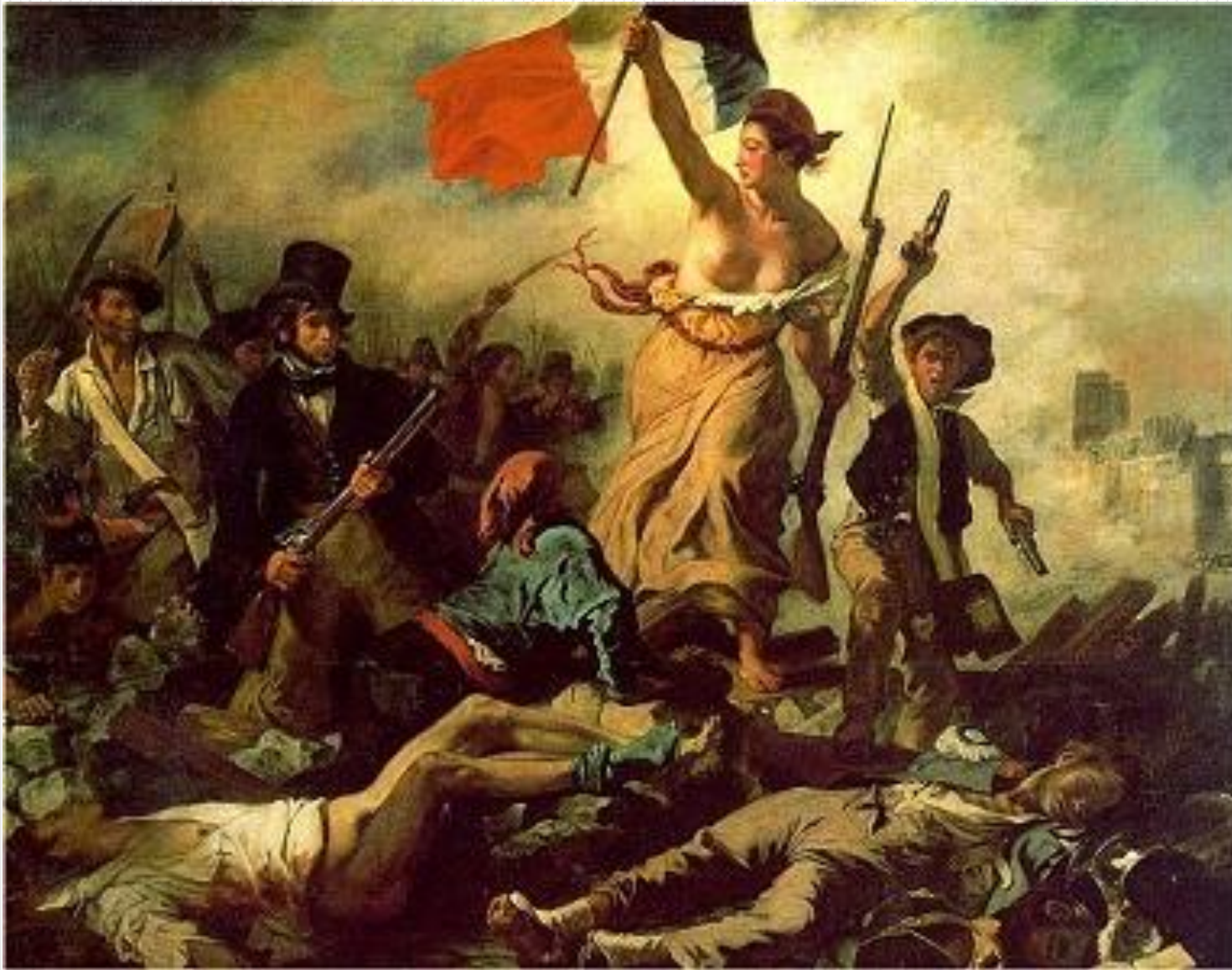
Рис.2 Э. Делакруа «Свобода, ведущая народ», 1830