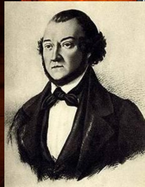
М. П. Мусоргский