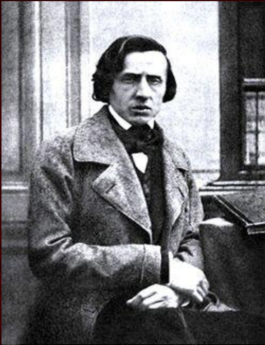
Фридерик Шопен польский композитор (1810-1849)

После Бетховена классицизм уступил место романтизму , и Шопен стал один из главных представителей этого направления в музыке.