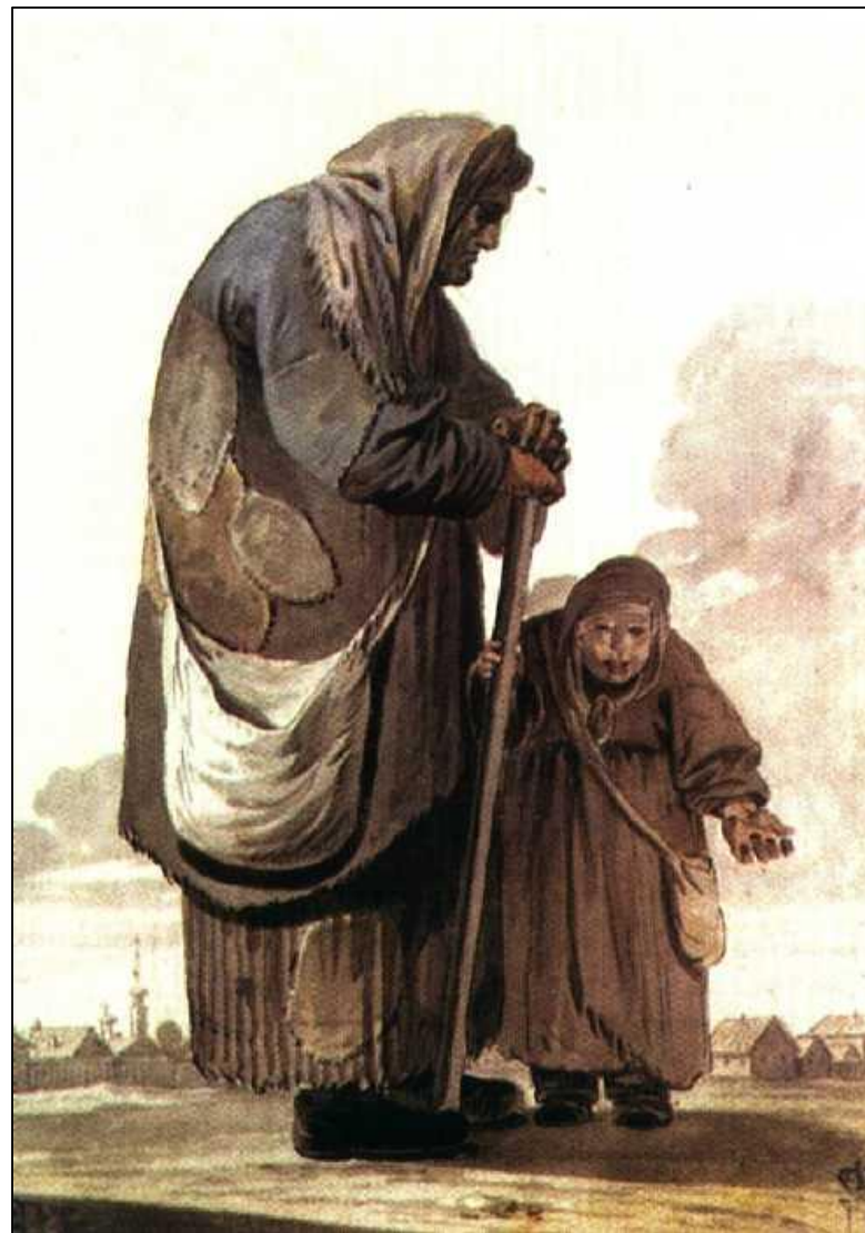
Нищая с девочкой-поводырем