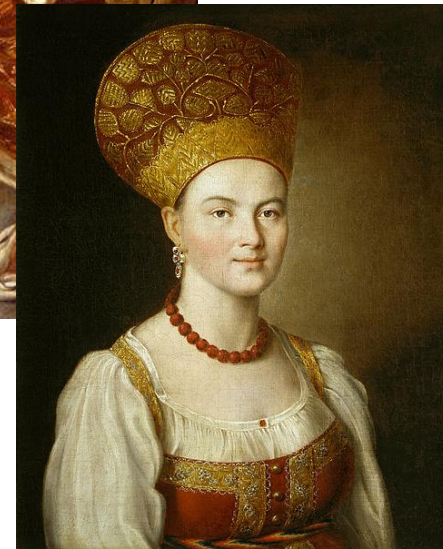
Портрет неизвестной крестьянки в русском костюме