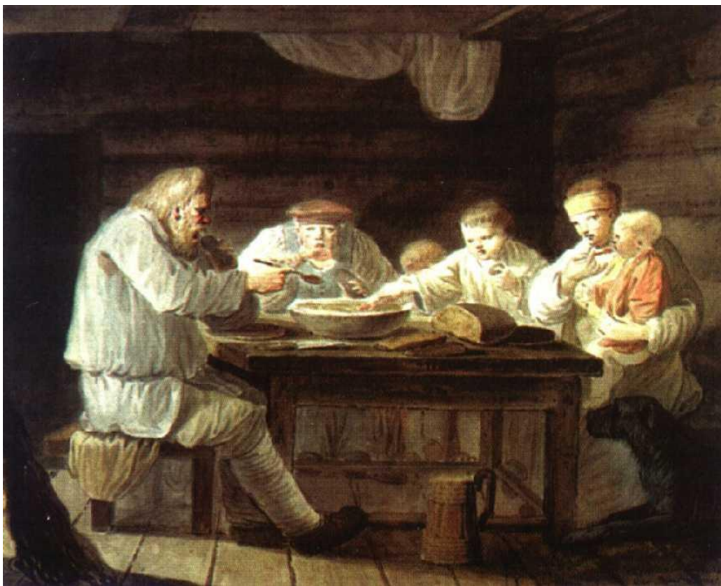
Крестьяне за обедом