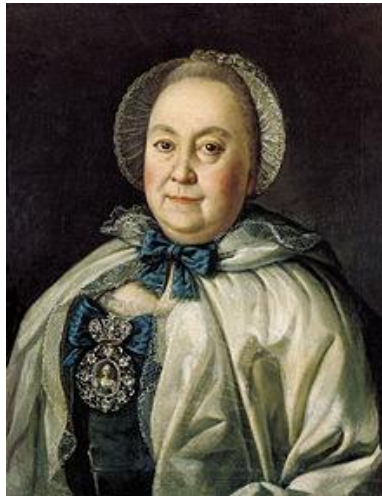
Портрет графини М. А. Румянцевой