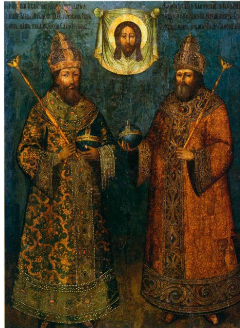
Царь Михаил Федорович и царь Алексей Михайлович, предстоящие перед образом Спаса Нерукотворного.