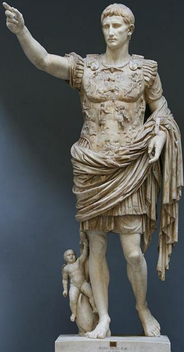
Август из Прима- Порта, I век Мрамор. Высота: 2,04 м Музей Кьярамонти, Ватикан