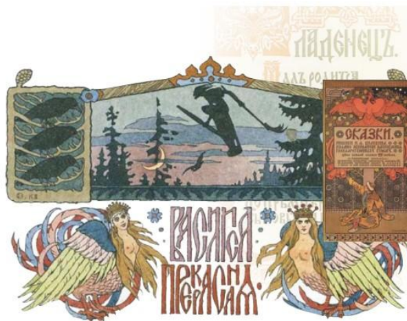
И. Билибин. Василиса прекрасная