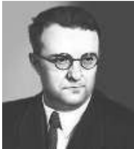
Георгий Васильевич Свиридов

В XX в. жанр иллюстрации представлен не только в книжной графике. Уникальным явлением в истории русской музыкальной культуры стало создание иллюстраций к литературным произведениям в музыке. Это и «Музыкальные иллюстрации к повести А. Пушкина «Метель» Г. Свиридова, и Симфонические гравюры «Дон Кихот» К. Караева к одноименному роману М. Сервантеса.