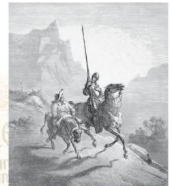
Г. Дорэ. Дон Кихот