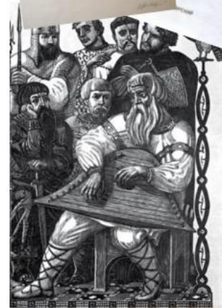
В. Фаворский. Повесть о полку Игореве...