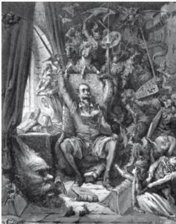
Г. Доре. Дон Кихот

Для многих поколений читателей «Робинзон Крузо» Д. Дефо неотделим от иллюстраций французского графика Гранвиля, а «Дон Кихот» М. Сервантеса, «Приключения барона Мюнхаузена» Р. Распе — от иллюстрации тоже французского графика Г. Доре.