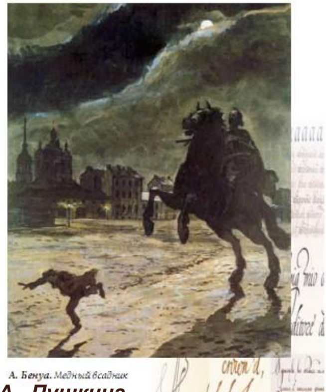
А. Бенуа. Медный всадник

В иллюстрациях А. Бенуа к произведениям А. Пушкина объединились большая эрудиция и безупречный вкус. Рисунки Бенуа к «Пиковой даме», «Медному всаднику», «Капитанской дочке» — явление высокой художественной культуры.