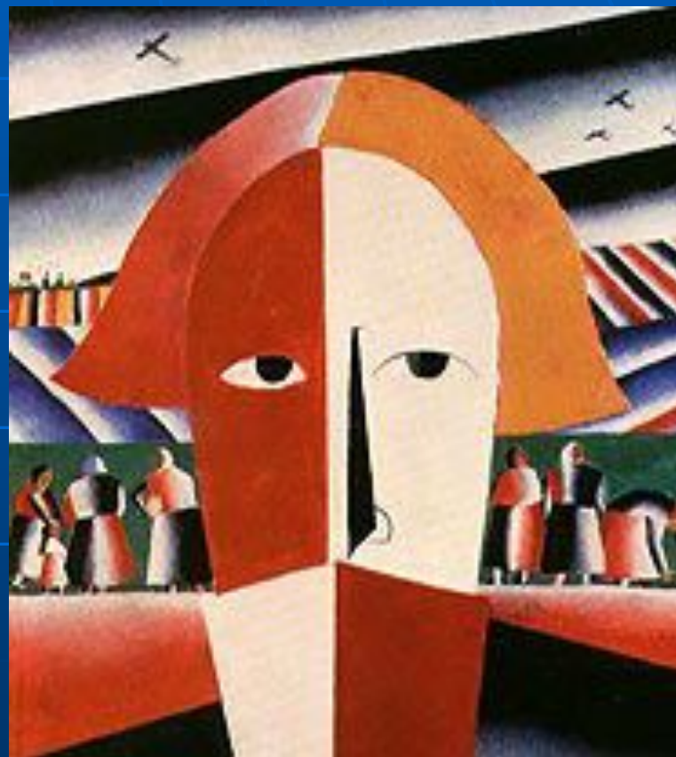
«Голова крестьянина». 1928-32.