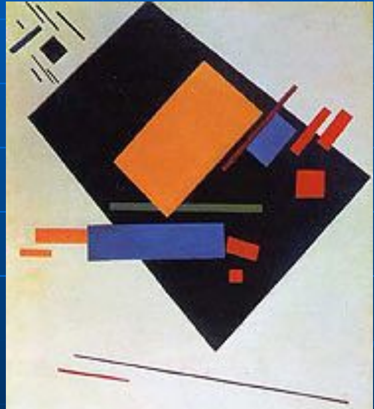
Казимир Малевич. «Супрематизм». 1915