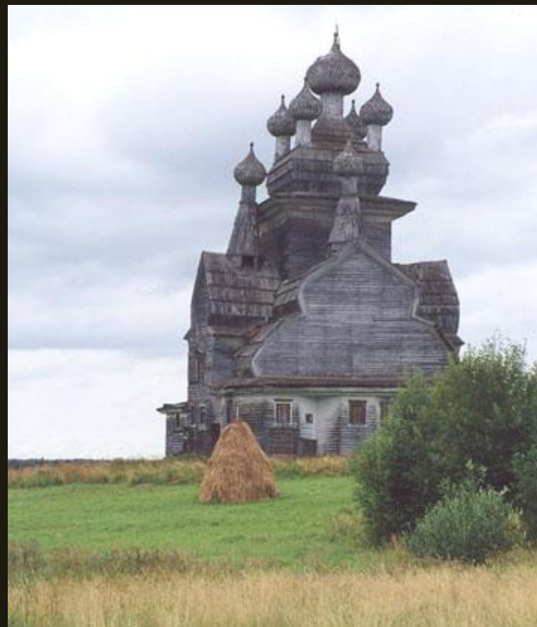
Церковь из с. Подпорожье Онежского р-на Архангельской обл.

Церковь из села Зачачье относится к типу восьмерик от земли с двумя прирубами.