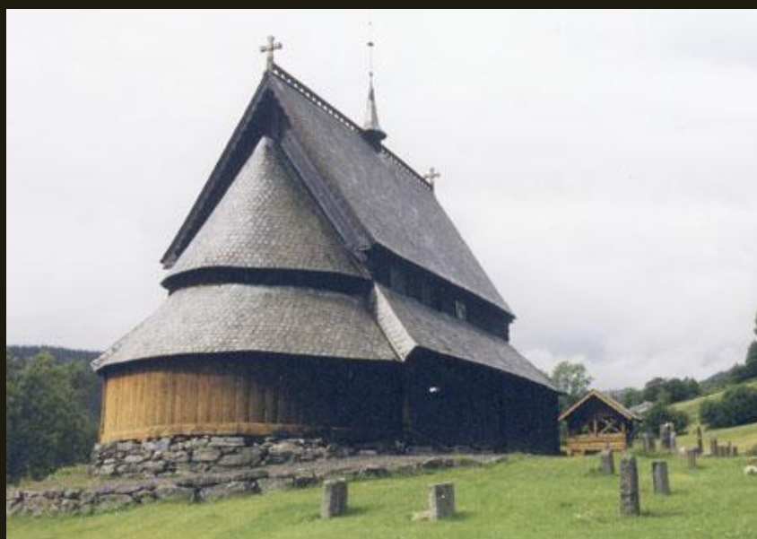
Церковь из с. Рейнли. Конец XIII в.