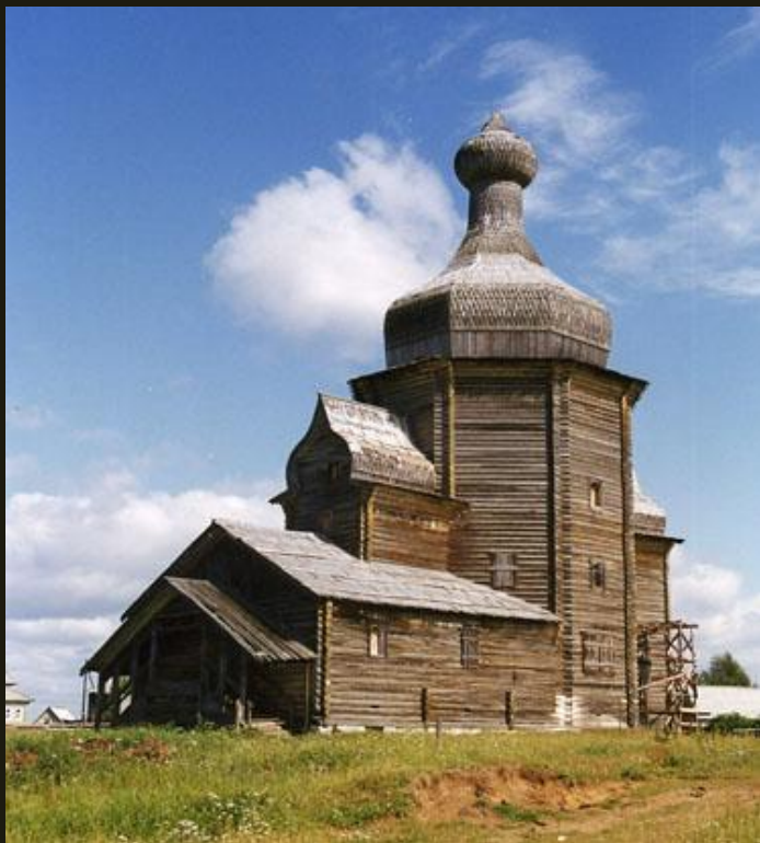
Церковь из с. Зачачье Емецкого р-на Архангельской обл. 1686

Церковь из села Зачачье относится к типу восьмерик от земли с двумя прирубами.