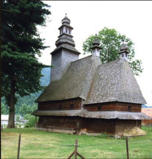
Церковь из с. Колочава Закарпатской обл. XVIII в.