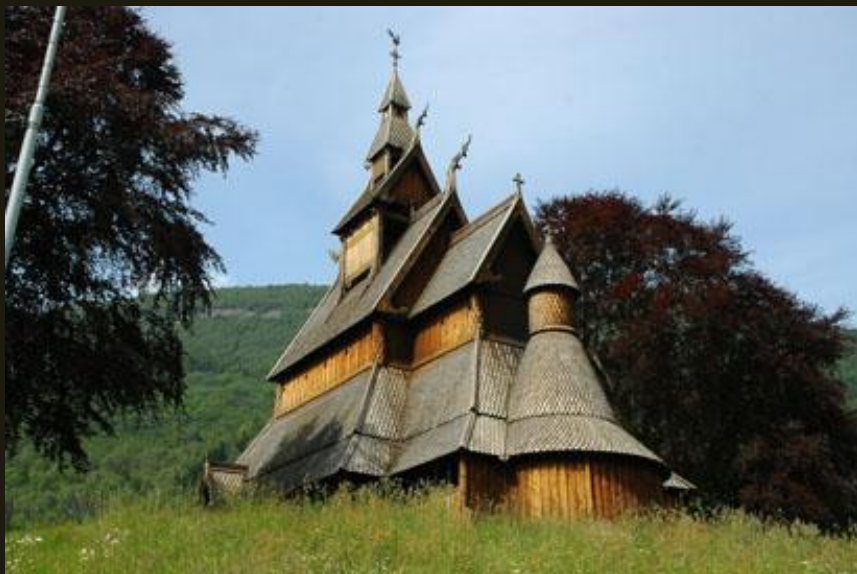
Церковь из с. Хопперстадт. XII в.