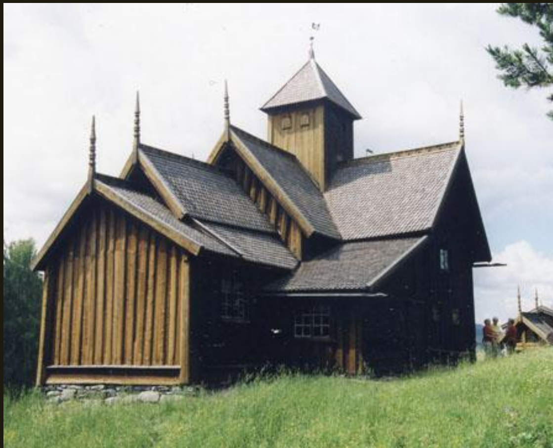
Церковь из с. Увдал. XII–XV вв.

Норвежские церкви – это ставкирки – каркасные конструкции, основу которых составляют два огромных бревна, верхнее и нижнее, с пазами, куда вертикально вставляются бревна стен. Целиком эта конструкция лучше всего видна на фотографии церкви в Увдале.