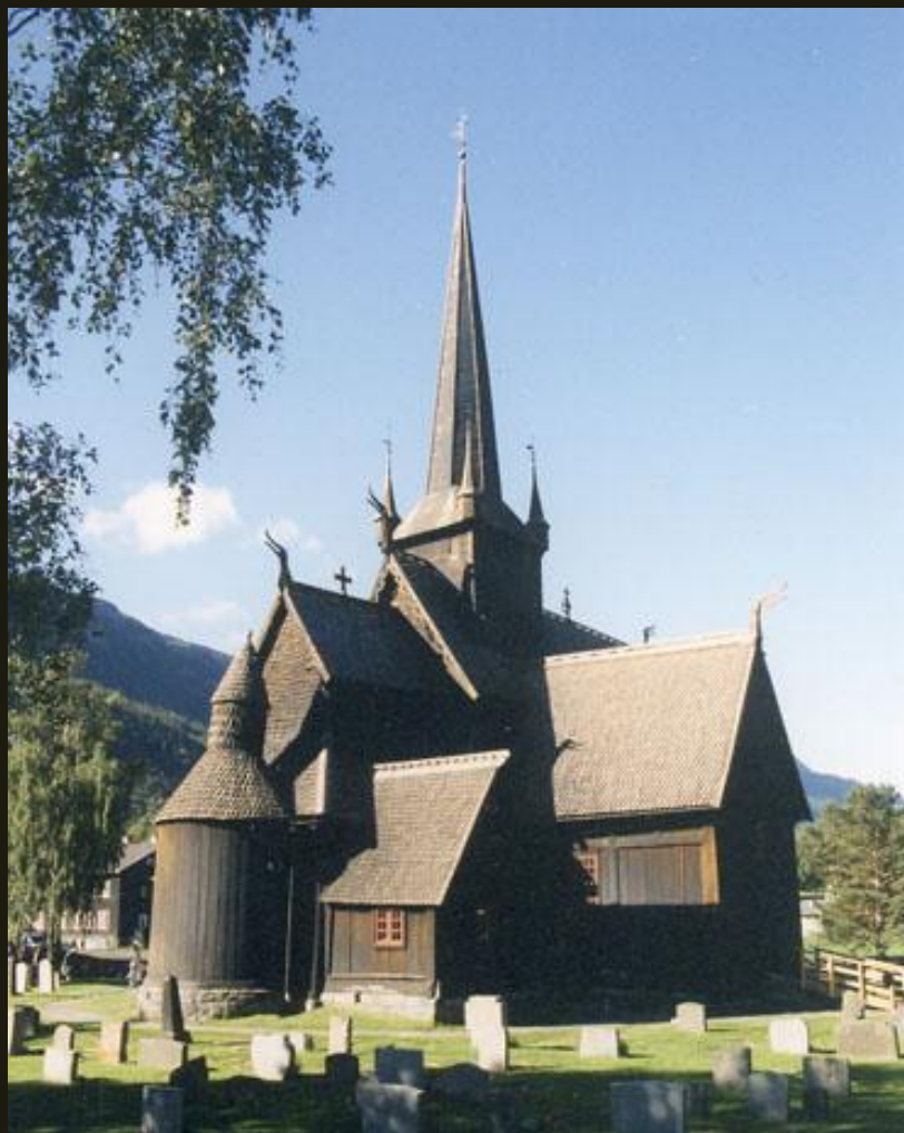
Церковь из с. Лом. XII–XIII вв.