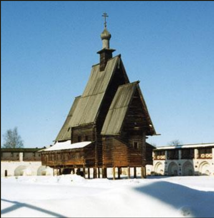
Церковь из с. Спас-Вежи Костромской обл. 1628

Типология русских деревянных храмов сложная.