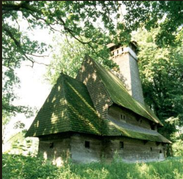
Церковь из с. Крайниково Закарпатской обл. 1668