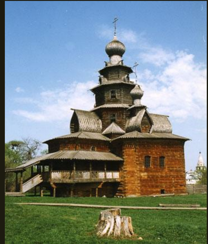
Церковь из с. Козлятьево Владимирской обл. 1756

Церковь Преображения из села Козлятьево относится к ярусному типу храма (распространенному в средней полосе России).