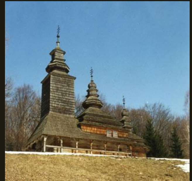
Церковь из с. Конора Закарпатской обл. 1745