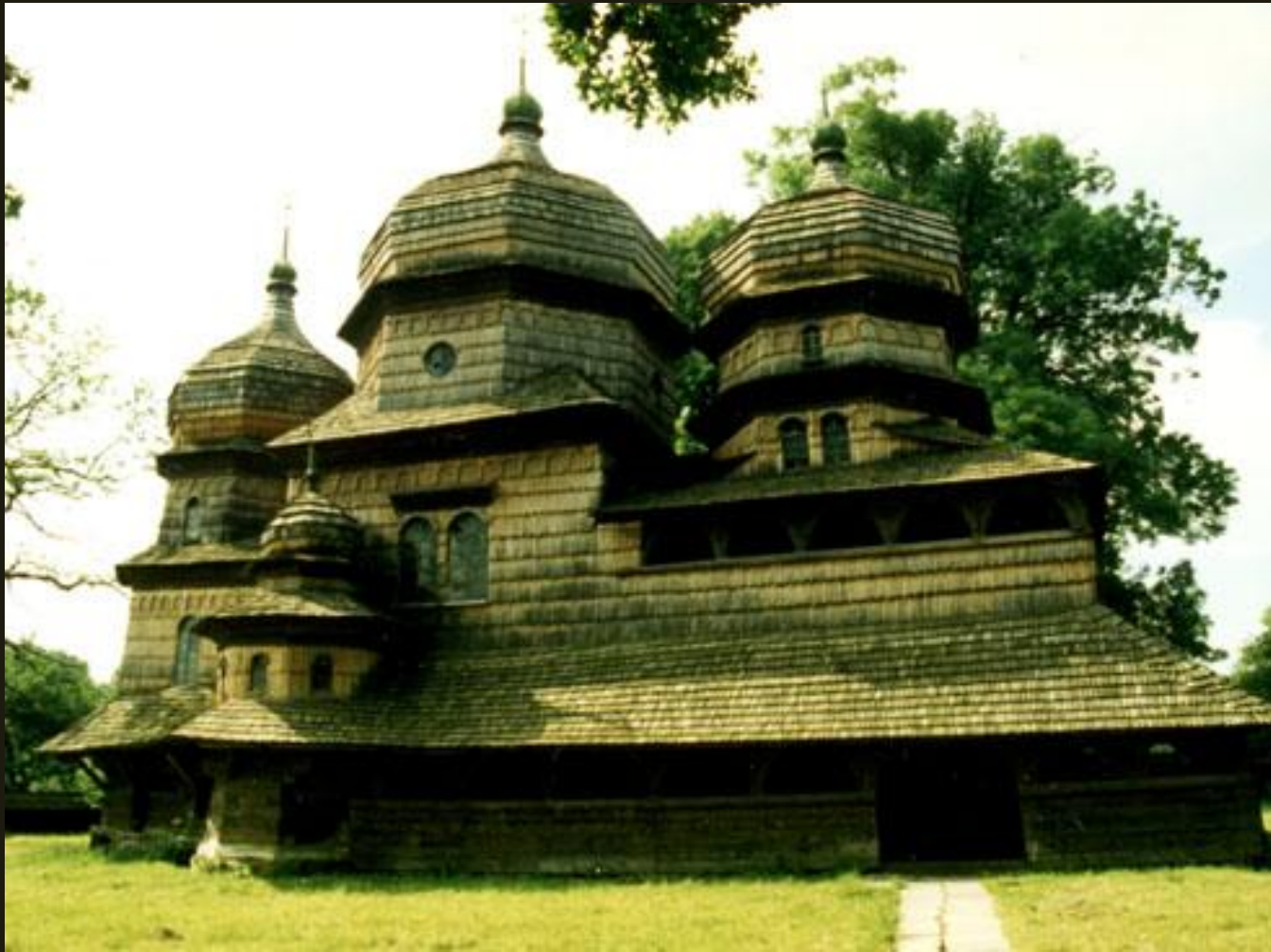
Церковь из с. Дрогобыч Львовской обл. Конец XV в.

Более ранняя постройка – храм святого Юра XV в. в Дрогобыче – трехсрубный.