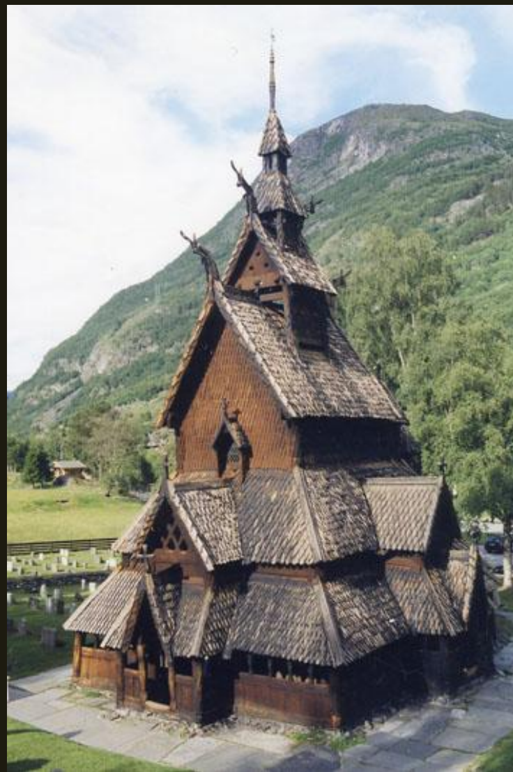
Церковь из с. Боргунд. XII в.