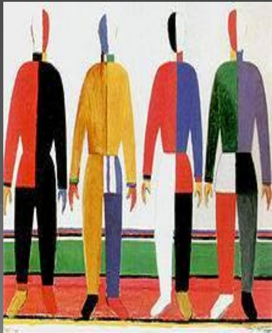
Казимир Малевич «Атлеты» 1933г.