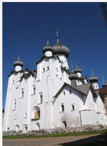
Спасо- Преображенский собор