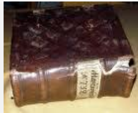
Книга из Соловецкого монастыря

В монастыре имелась огромная библиотека.