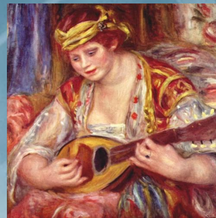
«Женщина с мандолиной»