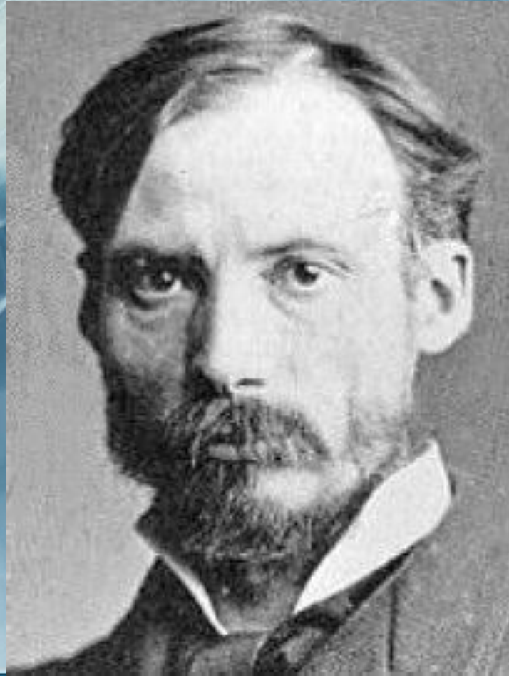
Ренуар, Пьер Огюст (25 февраля 1841-2 декабря 1919)