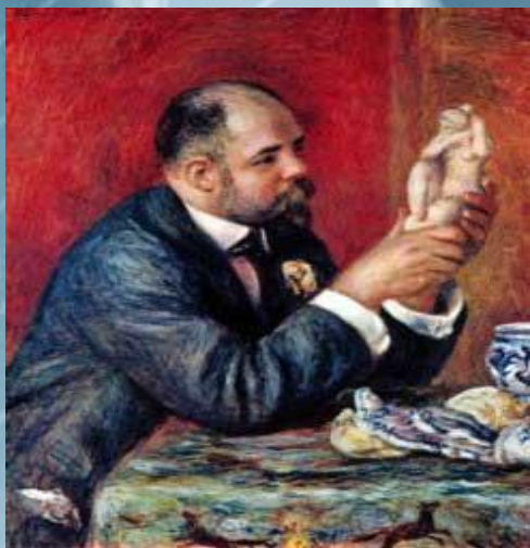
«Портрет Амбруаза Воллара»