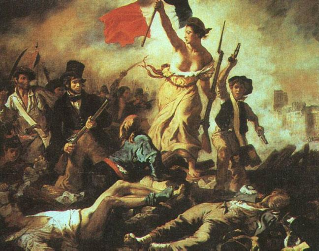
Эжен Делакруа "Свобода на баррикадах". 1830 г.

Только одна картина художника была написана непосредственно после современных ему событий - революции 1830 г. Она стала самым значительным и самым известным его произведением - "28 июля 1830 года" (" Свобода на баррикадах ", 1830, Лувр, Париж). Ее романтическая революционная символика, выраженная аллегорической фигурой Свободы с развевающимся национальным знаменем в руке, открыто призывала к борьбе и вселяла уверенность в неизбежной победе. Экспрессия и динамическая пластика полотна достигаются за счет использования лаконичных художественных приемов: композиция не перегружена изображением человеческих фигур, напряженная энергетика цветовой гаммы создается ударами красного и синего тонов.