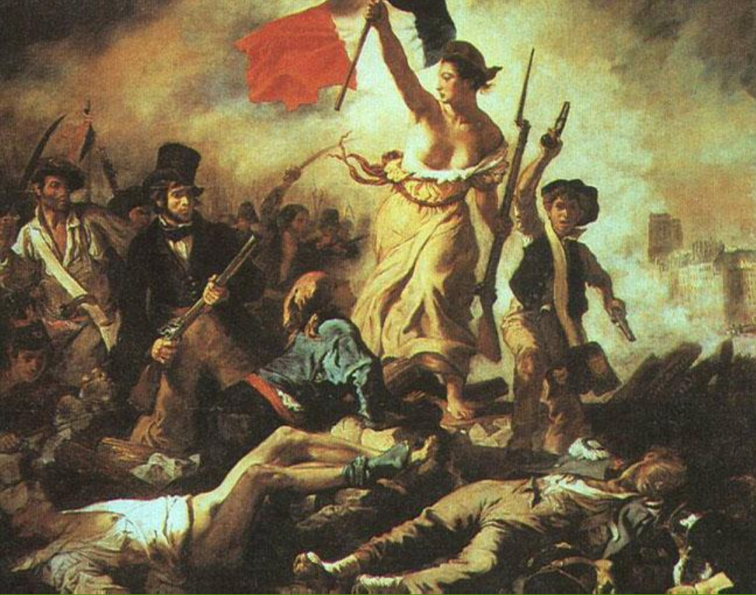
Эжен Делакруа "Свобода на баррикадах". 1830 г.

Только одна картина художника была написана непосредственно после современных ему событий - революции 1830 г. Она стала самым значительным и самым известным его произведением - "28 июля 1830 года" (" Свобода на баррикадах ", 1830, Лувр, Париж). Ее романтическая революционная символика, выраженная аллегорической фигурой Свободы с развевающимся национальным знаменем в руке, открыто призывала к борьбе и вселяла уверенность в неизбежной победе. Экспрессия и динамическая пластика полотна достигаются за счет использования лаконичных художественных приемов: композиция не перегружена изображением человеческих фигур, напряженная энергетика цветовой гаммы создается ударами красного и синего тонов.