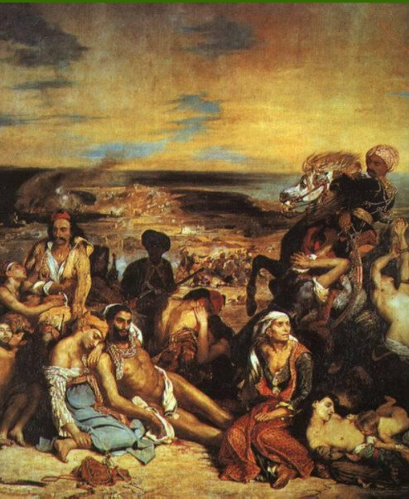
Эжен Делакруа "Резня в Хиосе". 1824 г.