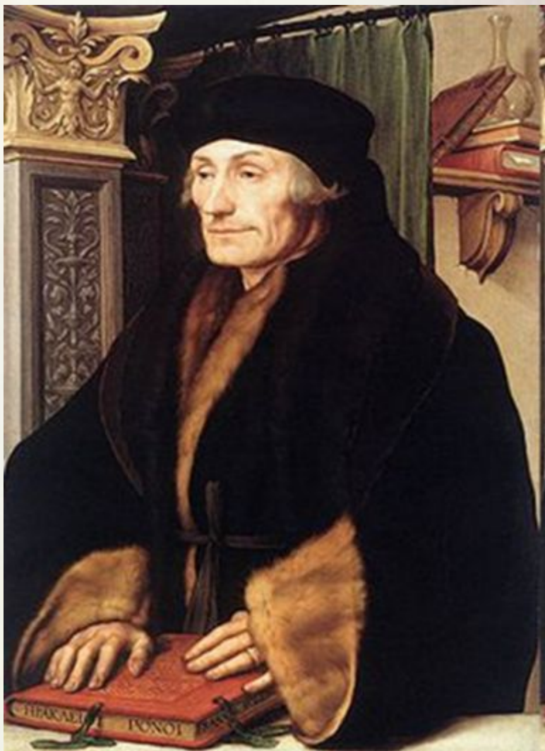
Эразм Роттердамский (1469 - 1536)

С. Цвейг, писатель, биограф гуманиста, назвал гуманиста «славой и светочем своего времени».