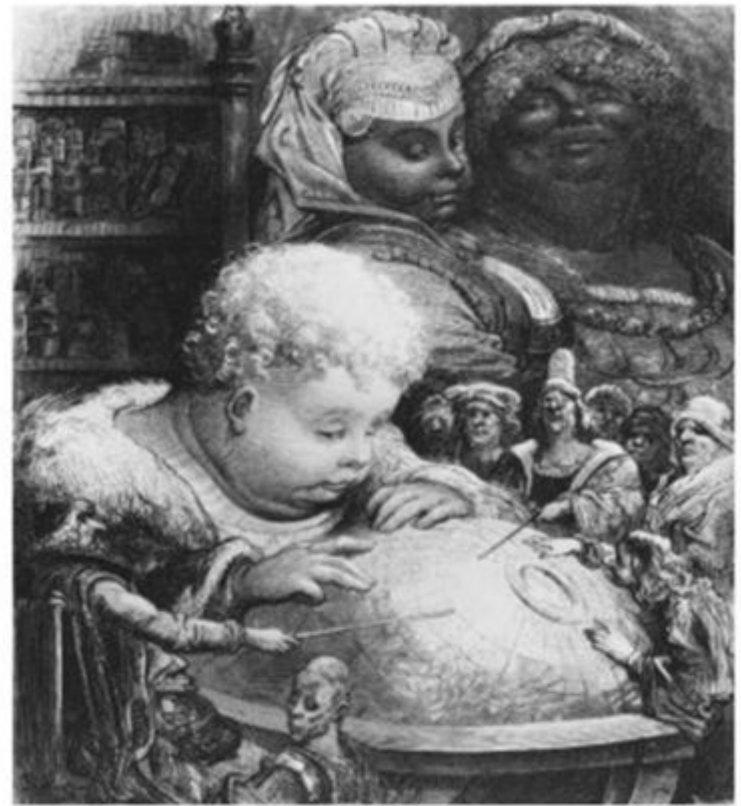
Юный Гаргантюа изучает глобус. Иллюстрация Гюстава Доре.