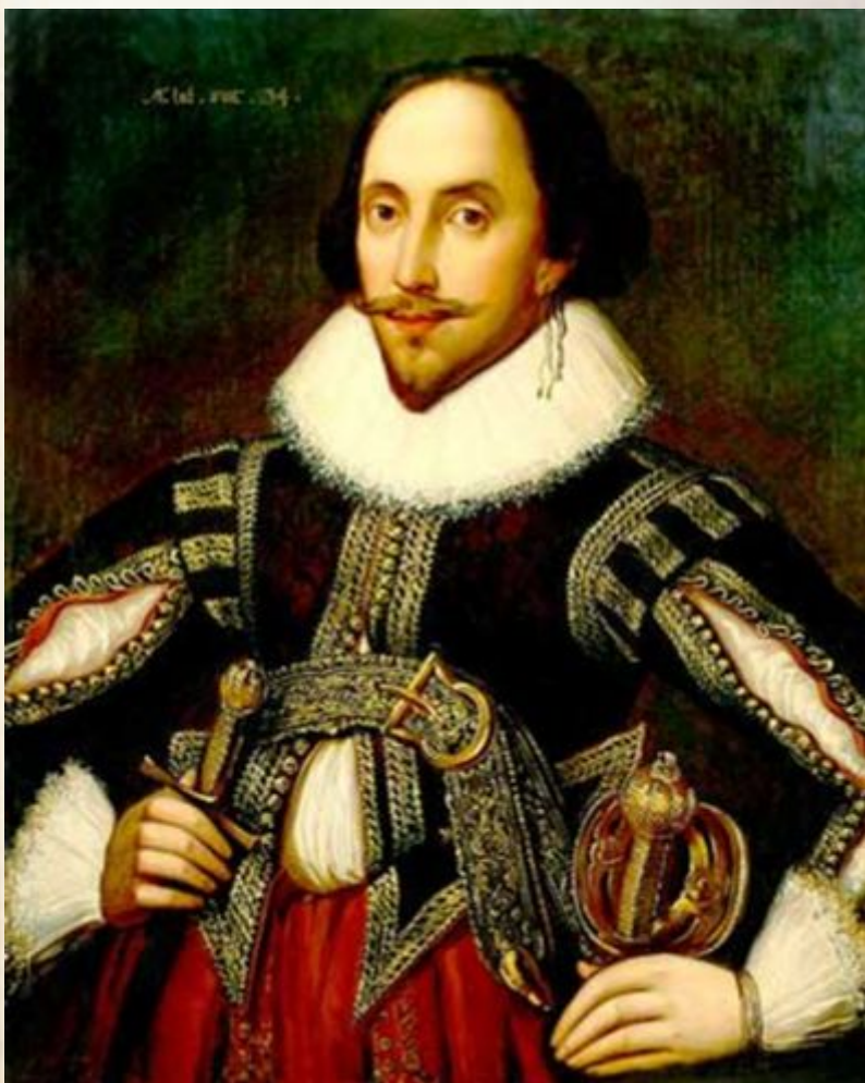
Уильям Шекспир (1564 - 1616)

английский драматург и поэт, один из самых знаменитых драматургов мира, автор по крайней мере 17 комедий, 10 хроник, 11 трагедий, 5 поэм и цикла из 154 сонетов.