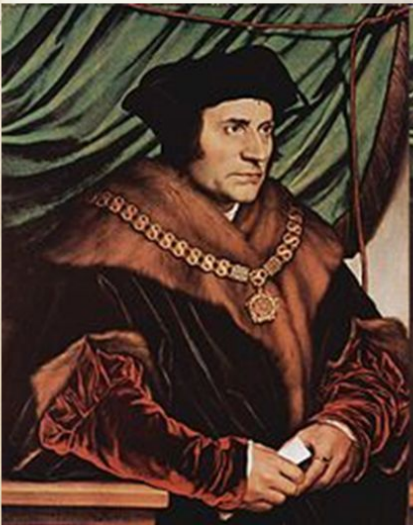
Томас Мор (1478 - 1535).

Английский мыслитель, писатель. Святой католической церкви.