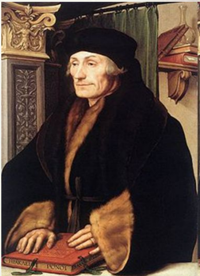
Эразм Роттердамский (1469 - 1536)

С. Цвейг, писатель, биограф гуманиста, назвал гуманиста «славой и светочем своего времени».