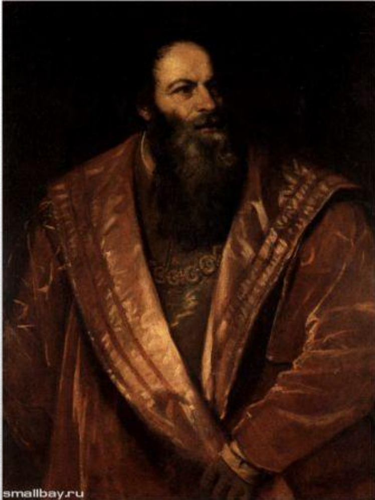
Пьетро Аретино (1545)