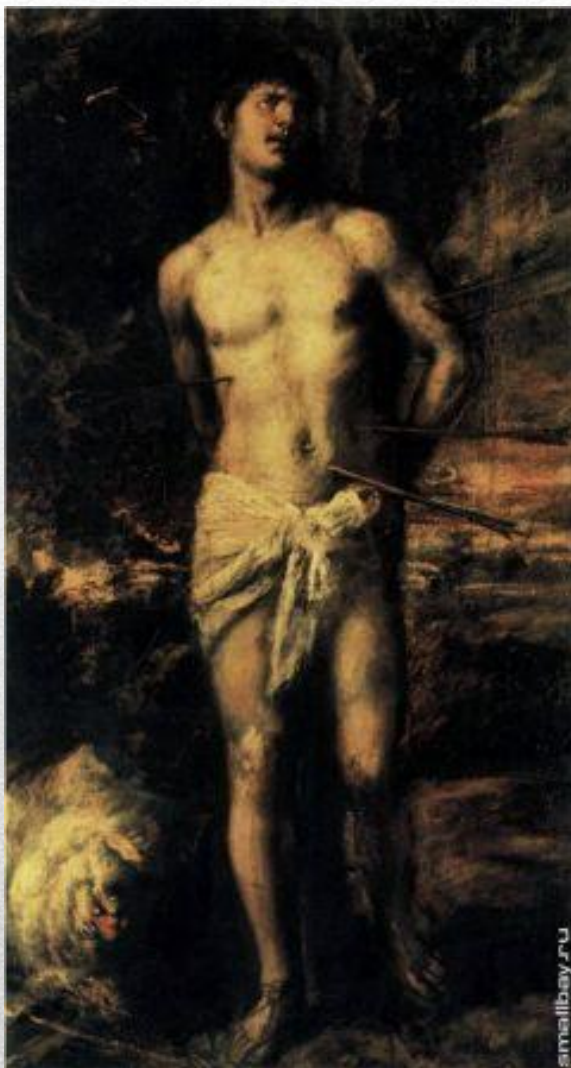
«Святой Себастьян», 1565-1570, Эрмитаж