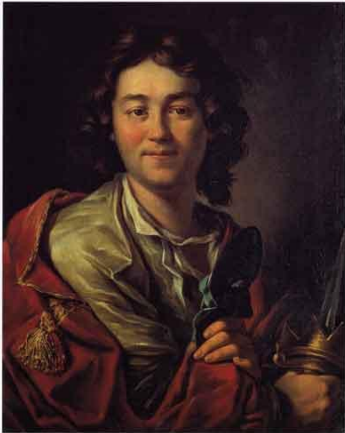
Ф. Г. Волков, 1762 г. Художник А. Лосенко

положил начало формированию важнейших традиций русского национального театра.