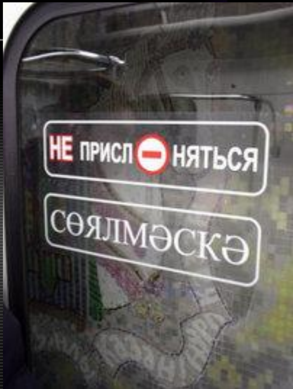
Двухязычный указатель в Казанском метро