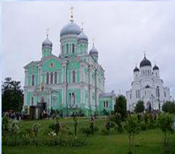
Троицкий собор (слева) и Преображенский собор (справа)

В 1842 году В 1842 году, через 9 лет после преставления Серафима, обе общины были объединены с наименованием Серафимо-Дивеевской. С 1853 года Казанская церковь с приделами стала существовать отдельно от новой общины.