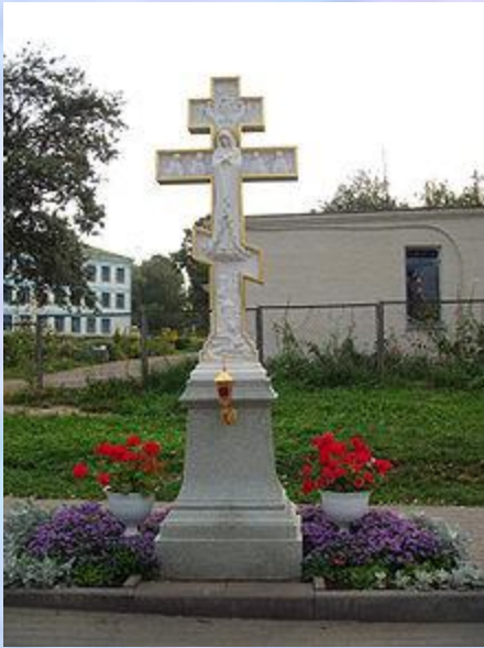
Крест у начала Святой канавки

25 ноября 1825 года Богородица явилась преподобному Серафиму и повелела основать Мельничную общину, указав как следует обнести это место канавой и валом. Копать Канавку должны были только сестры общины, а миряне могли помогать носить землю и насыпать вал.