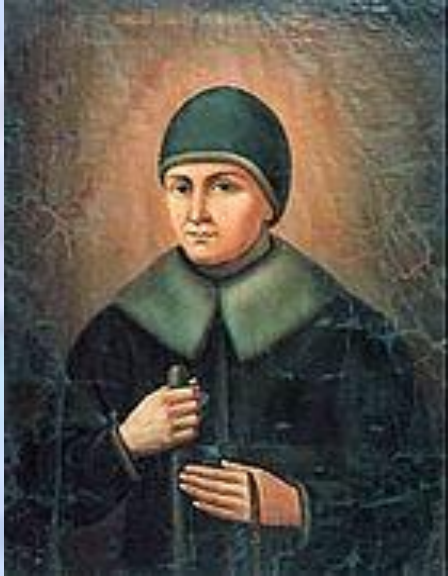
Портрет преподобной Александры

Монастырь возник в половине XVIII века Монастырь возник в половине XVIII века: около 1758 Монастырь возник в половине XVIII века: около 1758 прибыла в Киев Монастырь возник в половине XVIII века: около 1758 прибыла в Киев богатая рязанская помещица Агафья Семёновна Мельгунова Монастырь возник в половине XVIII века: около 1758 прибыла в Киев богатая рязанская помещица Агафья Семёновна Мельгунова († 13 июня 1789 Монастырь возник в половине XVIII века: около 1758 прибыла в Киев богатая рязанская