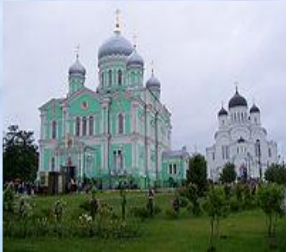
Троицкий собор (слева) и Преображенский собор (справа)

В 1842 году В 1842 году, через 9 лет после преставления Серафима, обе общины были объединены с наименованием Серафимо-Дивеевской. С 1853 года Казанская церковь с приделами стала существовать отдельно от новой общины.