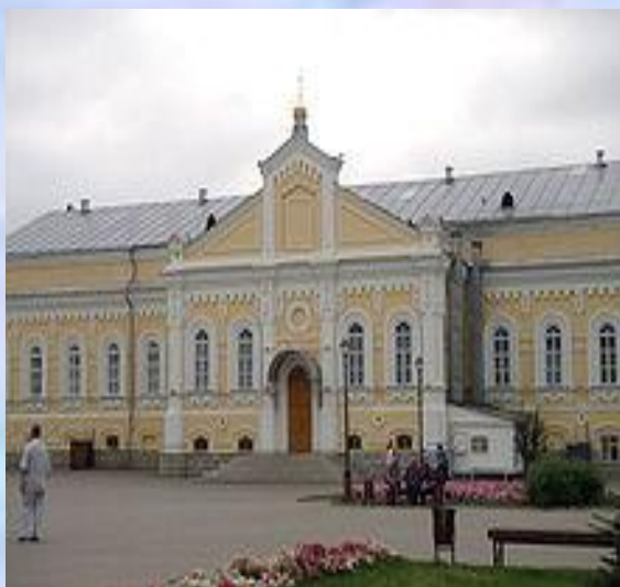
Трапезный храм во имя святого благочестивого князя Александра Невского

В обители проживает более 400 насельниц. С 1989 года в Дивееве было восстановлено и освящено семь храмов. Центром духовной жизни остается Троицкий собор со своей главной святыней — святыми мощами преподобного Серафима, Саровского чудотворца.