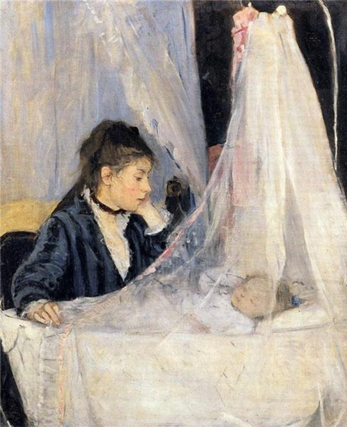
У колыбели Берта Моризо, 1872 г.)