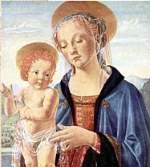
Андреа Верроккио. Мадонна с младенцем. 1470-1475 годы. Метрополитен-музей в Нью-Йорке.

Леонардо родился в семье богатого нотариуса. Он сложился как мастер, обучаясь у Андреа дель Верроккьо в 1467-1472 годах. Методы работы во флорентийской мастерской того времени, где труд художника был тесно сопряжен с техническими экспериментами, а также знакомство с астрономом П. Тосканелли способствовали зарождению научных интересов юного Леонардо.